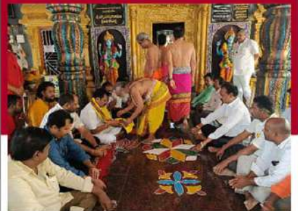
పాయకరావుపేటలో ప్రత్యేక పూజలు నిర్వహిస్తున్న కార్యకర్తలు