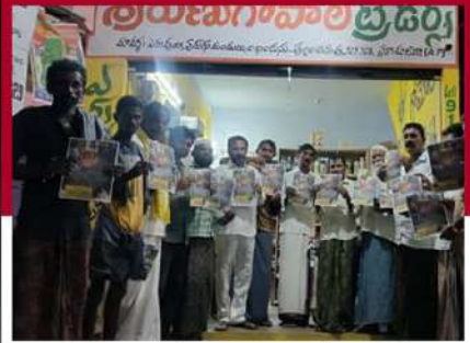
యర్రగోండపాలెంలో కరవత్రాలు పంపిణీ చేస్తున్న శ్రేణులు