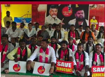
శ్రీకాళహస్తిలో కార్యకర్తల రిలే నిరాహార దీక్ష