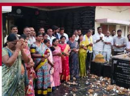
ప్రాద్దుటూరులోని ఆలయంలో కొబ్బరికాయలు కొట్టి చంద్రబాబుకు మద్దతు తెలుపుతున్న శ్రేణులు