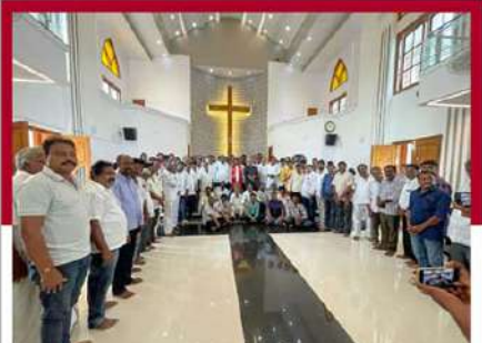
జగ్గంపేటలోని చర్చిలో ప్రార్థనలు నిర్వహిస్తున్న కార్యకర్తలు