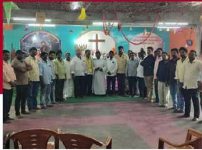
గురజాల చర్చిలో ప్రత్యేక ప్రార్థనలు నిర్వహిస్తున్న కార్యకర్తలు