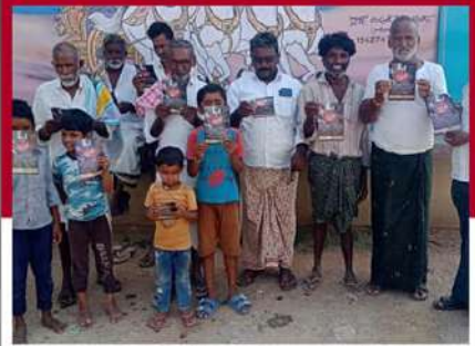
వాస్తవాలు తెలియజేస్తూ కరవత్రాలు పంపిణీ చేస్తున్న కార్యకర్తలు