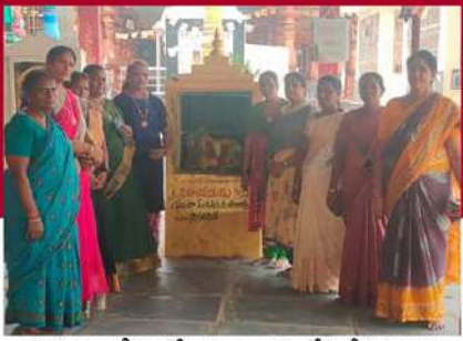
చంద్రబాబు క్షేమం కోరుతూ ఆలయాల్లో ప్రత్యేక పూజలు చేపడుతున్న తెలుగు మహిళలు