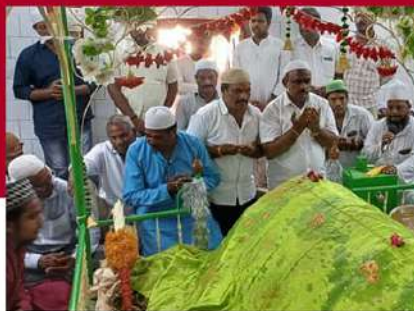
కశింకోట దర్గాలో ప్రార్థనలు నిర్వహిస్తున్న కార్యకర్తలు