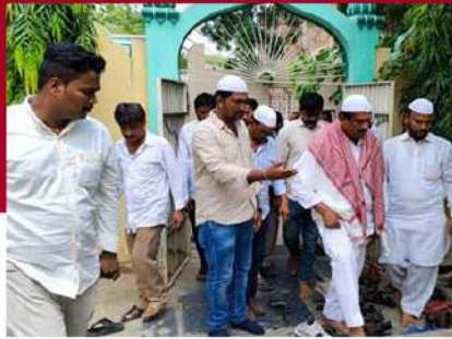
రాజంపేటలో భార్యల చెంగల రాయుడు ఆధ్వర్యంలో ప్రత్యేక ప్రార్థనలు