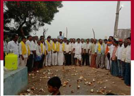
శింగనమలలో కొబ్బరికాయలు కొట్టి చంద్రబాబుకు మద్దతు తెలుపుతున్న కార్యకర్తలు