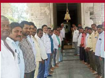
ప్రత్తిపాడులో ప్రత్యేక పూజలు చేపట్టిన కార్యకర్తలు