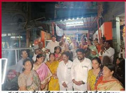
చంద్రబాబు క్షేమం కోరుతూ అలయాలో ప్రత్యేక పూజలు నిర్వహిస్తున్న చీరాల దీదీపీ కార్యకర్తలు