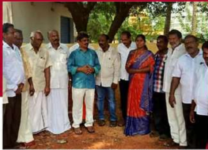
గూడూరులో ప్రత్యేక ప్రార్థనలు నిర్వహిస్తున్న శ్రేణులు