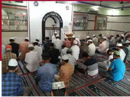
నంద్యాల నియోజకవర్గంలోని మసీదులో ప్రత్యేక ప్రార్థనలు నిర్వహిస్తున్న కార్యకర్తలు