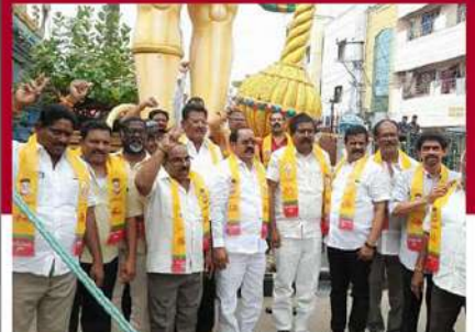
అనపర్తిలో బాబుకు మద్దతుగా ప్రత్యేక పూజలు నిర్వహిస్తున్న చిత్రం