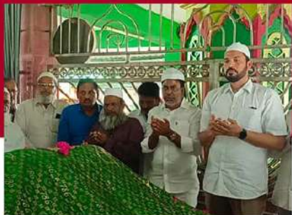
ఎం.ఎన్ బేగ్ ఆఫీసర్స్ లో గుంటూరు శివారు పెదకాకాని దర్గాలో ప్రత్యేక ప్రార్థనలు నిర్వహిస్తున్న చిత్రం