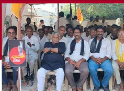
చంద్రబాబుకు మద్దతుగా రిలే నిరాహార దీక్ష చేపడుతున్న జ్యోతుల నెవ్రూ