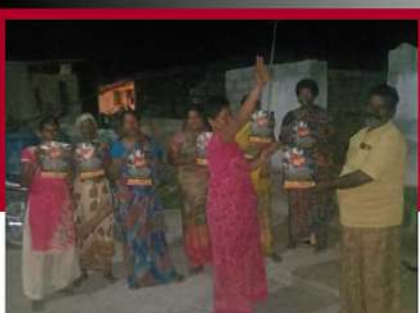
దర్శిలో కరవత్రాలు పంపిణీ చేస్తున్న కార్యకర్తలు