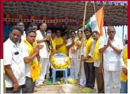
పి.గన్నవరంలో లిలే నిరాహార దీక్ష చేపడుతున్న కార్యకర్తలు