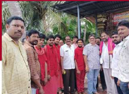
ముప్పడివరంలో ప్రత్యేక ప్రార్థనలు నిర్వహిస్తున్న కార్యకర్తలు