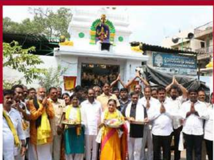
తిరువతిలో ఆలయంలో ప్రత్యేక పూజలు నిర్వహిస్తున్న కార్యకర్తలు