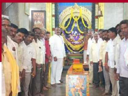
చంద్రబాబుకు మద్దతుగా ఆలయంలో ప్రత్యేక పూజలు నిర్వహిస్తున్న కార్యకర్తలు