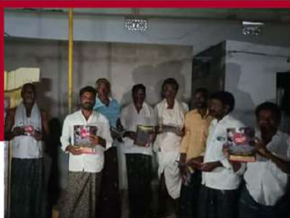
దర్శిలో సిల్క్ డెవలప్ మెంట్ వాస్తవాలు తెలియజేస్తూ కరవత్రాలు పంపిణీ చేస్తున్న కార్యకర్తలు