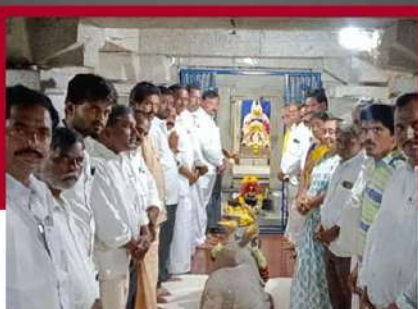
ప్రాద్దుటూరులోని ఆలయంలో పూజలు చేస్తున్న కార్యకర్తలు