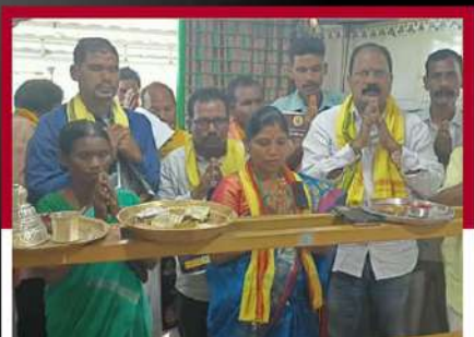
చంద్రబాబుకు మద్దతుగా పూజలు చేపడుతున్న కార్యకర్తలు