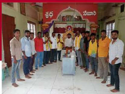
రేపల్లిలో చంద్రబాబుకు మద్దతుగా ప్రత్యేక పూజలు చేపడుతున్న కార్యకర్తలు