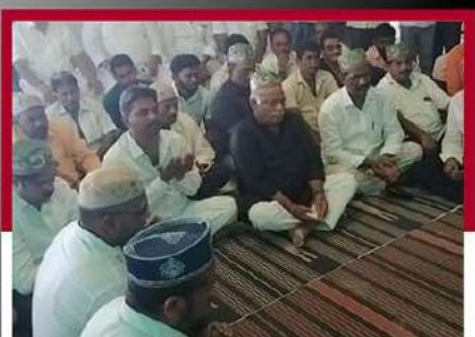
కిర్లంపూడిలోని మనీదులో ప్రార్థనలు నిర్వహిస్తున్న కార్యకర్తలు