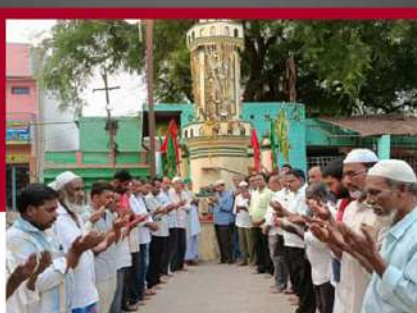
పిలేరు టౌన్ లో సామూహిక ప్రార్థనలు నిర్వహిస్తున్న శ్రేణులు