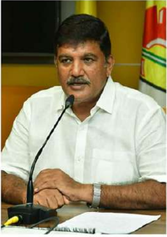
అజ్ఞానానికి నిద్రాసనం. నోరుండని జప్తుమొచ్చినట్లు మాట్లాడే మంత్రులకు ప్రజలే తగిన విధంగా బుద్ధి చెబుతారు. చంద్రబాబునాయుడి భద్రత, జైల్లోని పరిస్థితులపై ప్రజలు అందరికీనూ స్పష్టం చేయడం మంత్రులకు హాస్యంగా కనిపిస్తోందని సరేంద్ర దుర్జయబట్టారు.

తాము చెప్పినట్లు వినడం లేదనే ఆయన మాత్రం ను తప్పించా? అధికారిని మార్చడం ద్వారా ప్రభుత్వం పెద్దకుట్రలు ప్రణాళికలు వేస్తోందని ఆరోపించాడు. శాంతిభద్రతల వ్యవహారాలు... వాటిని పక్కనవేస్తేనే విధానాలు... విచారణ సంస్థలు అన్నీ ముఖ్యమంత్రి అధీనంలోనే ఉంటాయనేది అందరికీ తెలుసనివ్వారు. తెలుగుదేశం ప్రభుత్వంలో తీసుకున్న నిర్ణయాలపై విచారణ జరిపే సంస్థలు, అధికారులు అందరూ ముఖ్యమంత్రి కనుసన్నల్లోనే పనిచేస్తున్నారని ప్రజలకు బాగా తెలుసు. ముఖ్యమంత్రి... ప్రభుత్వం మోపే అన్ని అధికారాలు... అధికారులు తెలుగుదేశం పార్టీ ఎన్నికకప్పుడు అధికారంలో సహా సమాధానం చెబుతూనే ఉంది. స్మిల్ డెవలప్ మెంట్ కార్పొరేషన్ కు సంబంధించిన వాస్తవాలను అన్నీ రూపొందించే ప్రజల ముందు ఉంది. అవేమీ ఈ ముఖ్యమంత్రికి, ప్రభుత్వానికి కనిపించవు. కేవలం చంద్రబాబు జైల్లో ఉండాలి... తాము అనందించాలన్నదే వారి లక్ష్యం. చంద్రబాబు అరెస్ట్ పై... ఆయన జైల్లో ఉండటంపై మంత్రులు అందరికీ రాందాటు, అమర్చారు... మరొకరిని వ్యాఖ్యలు వారి అహంకారానికి,