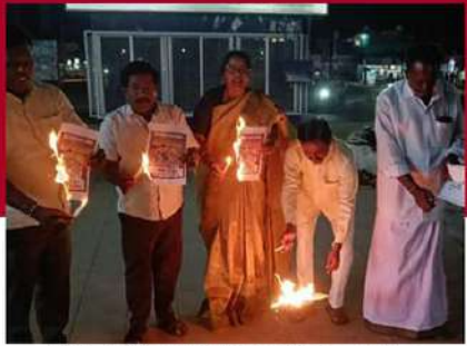
రేడిగుంటలో ఆందోళన వ్యక్తం చేస్తున్న కార్యకర్తలు