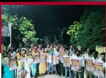
చిత్తూరులో షుకార్పూలతో ఆందోళన వ్యక్తం చేస్తున్న చిత్రం