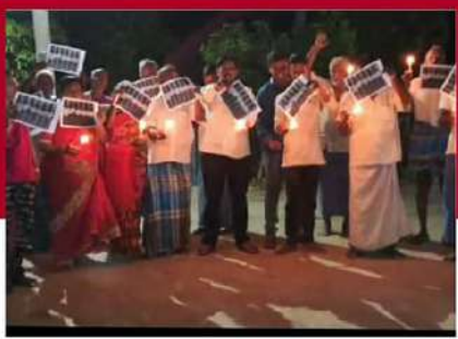
నగిరిలో ఆందోళన వ్యక్తం చేస్తున్న కార్యకర్తలు