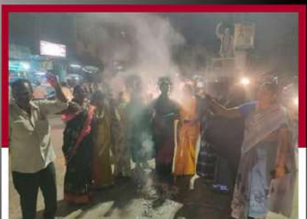
ధర్మవరంలో మహిళల ఆందోళన