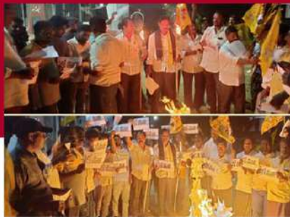
తిరువూరులో టీడీపీ కార్యకర్తల జగనాసుర దహనం