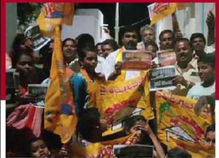
తంబలపల్లిలో షకార్పాలతో ఆందోళన వ్యక్తం చేస్తున్న కార్యకర్తలు