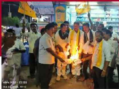
కాకినాడలో టీడీపీ శ్రేణుల నిరసన