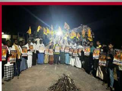
కడప జిల్లా ఖాజీపేటలో జగనాసుర దహనం కార్యక్రమంలో భాగంగా కార్యకర్తల నిరసన