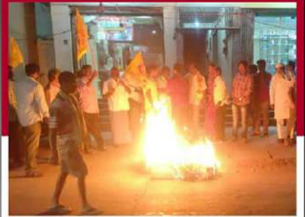
చైకలూరులో పత్రాల దహనం చేస్తున్న శ్రేణులు