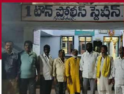
గుంతకల్లులో టీడీపీ కార్యకర్తల ఆందోళన