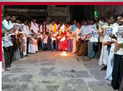
రావ్వాడులో ఆందోళన వ్యక్తం చేస్తున్న కార్యకర్తలు