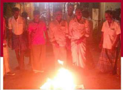
పశ్చిమోడలో ఆందోళన వ్యక్తం చేస్తున్న కార్యకర్తలు