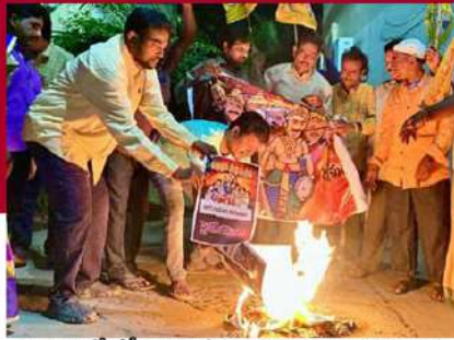
నెల్లూరులో జీసీ రాష్ట్ర ఉపాధ్యక్షుడు ధర్మవరం సుబ్బారావు ఆధ్వర్యంలో పత్రాలను దహనం చేస్తున్న కార్యకర్తలు