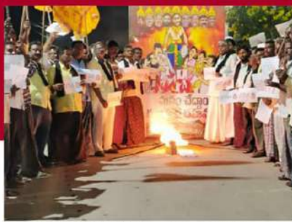
నందిగామలో టీడీపీ శ్రేణుల జగనాసుర దహనం