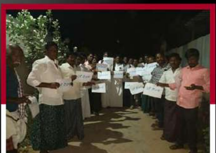
సింగంపల్లిలో ప్లకార్డులతో ఆందోళన వ్యక్తం చేస్తున్న శ్రీమలు