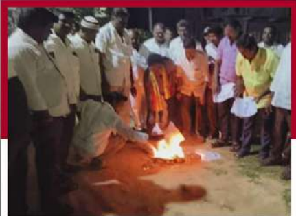
వెంకటగిరిలో పత్రాలు దహనం చేస్తున్న కార్యకర్తలు