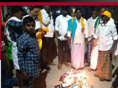
పత్తికొండలో ఆందోళన వ్యక్తం చేస్తున్న కార్యకర్తలు