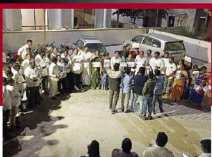
కుప్పంలో ఆందోళన వ్యక్తం చేస్తున్న కార్యకర్తలు