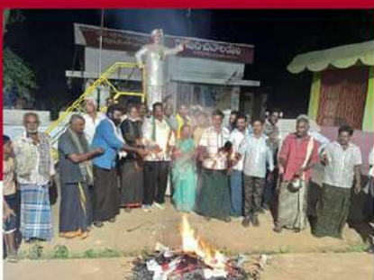
గన్నవరం నియోజకవర్గం బాపులపాడు మండలంలో పత్రాలు దహనం చేస్తున్న కార్యకర్తలు