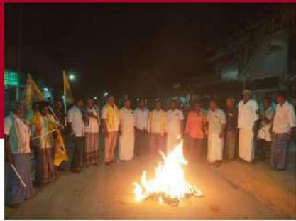
జీడి నెల్లూరులో రోడ్డుపై పత్రాలు దహనం చేస్తున్న కార్యకర్తలు