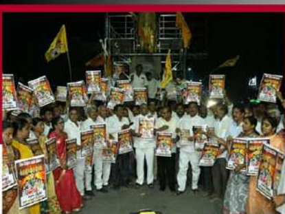
గుంటూరు పశ్చిమ నియోజకవర్గంలో జగనాసుర దహనం నిరసన కార్యక్రమం