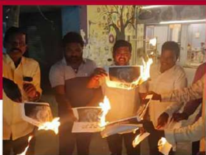
తిరుపతిలో పత్రాలు దహనం చేస్తున్న కార్యకర్తలు