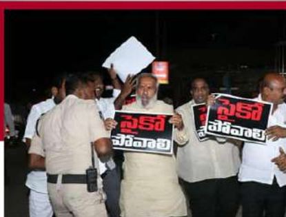
గూడూరులో కార్యకర్తలను అడ్డుకుంటున్న పోలీసులు