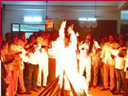
చిలకలూరిపేటలో పత్రాలను దహనం చేస్తున్న కార్యకర్తలు