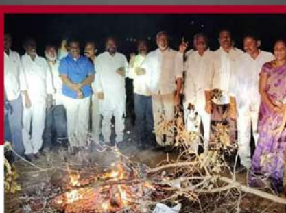
చంద్రగిరి నియోజకవర్గంలో టీడీపీ కార్యకర్తల ఆందోళన