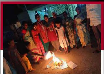
దద్దిలో నిరసన వ్యక్తం చేస్తున్న కార్యకర్తలు