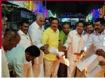
మంగళగిరిలో పత్రాలు దహనం చేస్తున్న శ్రేణులు