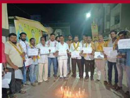
తునిలో షకార్పాలతో నిరసన తెలుపుతున్న శ్రేణులు