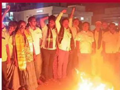
ఆత్మకూరులో నిరసన వ్యక్తం చేస్తున్న శ్రేణులు