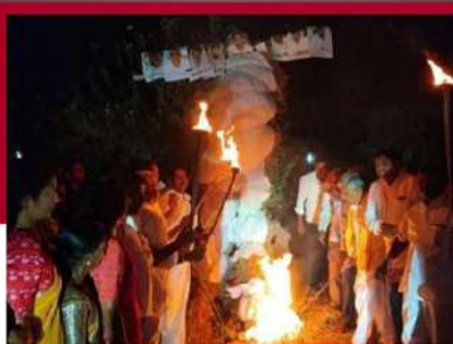
కళ్యాణదుర్గంలో నిరసన వ్యక్తం చేస్తున్న కార్యకర్తలు