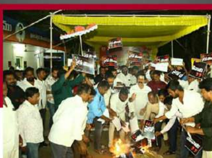
నెల్లూరులో పత్రాలు దహనం చేస్తున్న కార్యకర్తలు