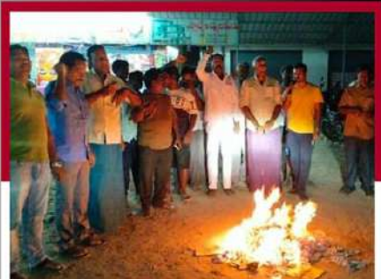
నిడదవోలలో ఆందోళన వ్యక్తం చేస్తున్న కార్యకర్తలు