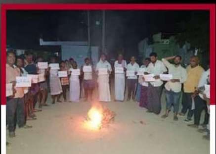
పెనుకొండలో ఆందోళన వ్యక్తం చేస్తున్న కార్యకర్తలు