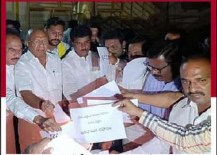
కర్నూలులో టీజీ భారత్ ఆధ్వర్యంలో నిరసన