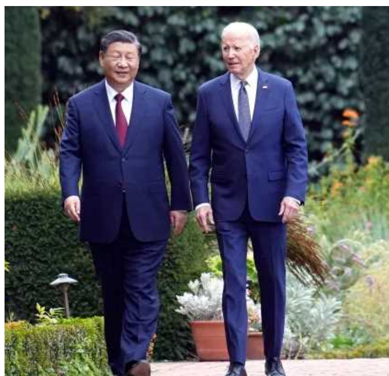
కంపెనీలపై చర్యలు తీసుకునేందుకు ఈ బేటీలో జిన్ పింగ్ అంగీకరించినట్లు సీనియర్ అధికారి ఒకరు వెల్లడించారు. దీంతో పాటు అమెరికా, చైనా మధ్య సైనిక స్థాయి చర్చల పునరుద్ధరణకు దేశాధినేతలు అంగీకరించినట్లు తెలుస్తోంది. తైవాన్ అంశంపైనూ ఫలప్రదమైన చర్చ జరిగినట్లు అధికారిక వర్గాల సమాచారం. రెండు దేశాల సంబంధాలు దెబ్బతినకుండా ఉండేలా చర్యలు చేపట్టేందుకు బైడెన్, జిన్ పింగ్ అంగీకరించినట్లు సదరు వర్గాలు తెలిపాయి.

అమెరికాలో అక్రమంగా డ్రగ్స్ వ్యాపారం నిర్వహిస్తున్న చైనా