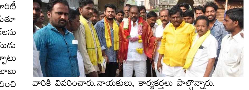
వారికి వివరించారు. నాయకులు, కార్యకర్తలు పాల్గొన్నారు.