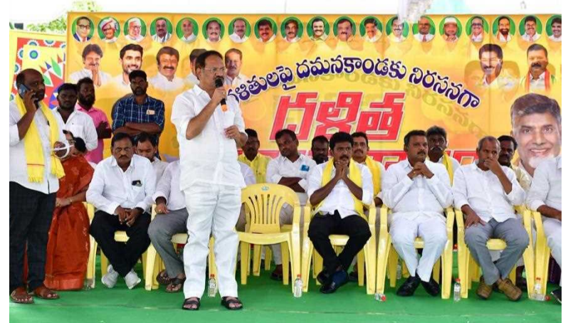
చేసిన ఘనత టీడీపీ పార్టీకే దక్కింది. ఎస్సీ, ఎస్టీ చట్టం చంద్రబాబు పోరాట ఫలితమే.దళితుల పంతం..జగన్మోహన్ రెడ్డి అంతం" అంటూ పిలుపునిచ్చారు.