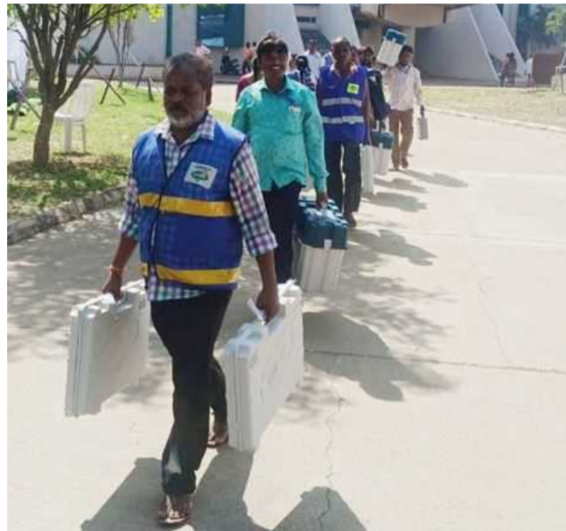
సమస్యాత్మక నియోజకవర్గాలు సిర్సూర్, చెన్నూరు, బెల్లంపల్లి, మంచీర్యాల, ఆసిఫాబాద్, మంథని, భూపాలపల్లి, ములుగు, పినపాక, ఇల్లందు, కొత్తగూడెం, అశ్వరావుపేట, భద్రాచలం

పురుషులు: 1కోటి 62లక్షల 98వేల 418ఓట్లు మహిళలు: 1కోటి 63లక్షల 1705 ఓట్లు రాష్ట్ర వ్యాప్తంగా 2676 ట్రాన్స్ పాండర్ ఓట్లు కొత్తగా యంగ్ ఓటర్లు (18-19): 9లక్షల 99వేల 667 మంది అబ్బాయిలు: 570274 అమ్మాయిలు: 429273 ట్రాన్స్ జెండర్స్: 120 మంది సీనియర్ సిటిజన్ ఓటర్లు (80ఏళ్ల పైబడి): 4,40,371 మంది పురుషులు: 1,89,519 మహిళలు: 2,50,840 ట్రాన్స్ జెండర్లు: 12 మంది ఎన్ఐఐఓ ఓటర్లు: 2933 దివ్యాంగులు: 5లక్షల 6వేల 921 మంది రాష్ట్రవ్యాప్తంగా 12వేల సమస్యాత్మక పోలింగ్ కేంద్రాలు గ్రేటర్ హైదరాబాద్ లో 1800 పోలింగ్ విధుల్లో 2.5 లక్షల మంది సిబ్బంది