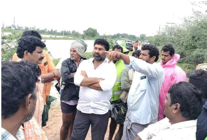
నెల్లూరు రూరల్ పరిధిలోని సాత్ మోపూర్లో కనుపూర్ కెనాల్