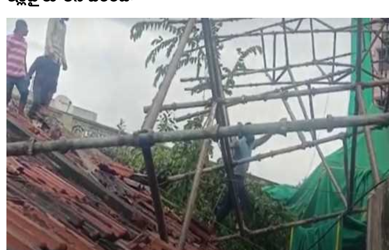
విజయవాడ బీఆర్ డిఎస్ రోడ్డులోని భానునగర్ లో పెను ప్రమాదం తప్పింది. నిర్మాణంలో ఉన్న భవనానికి ప్లాస్టరింగ్ చేసేందుకు కట్టిన పరంజా కూలిపోయింది. తుఫాన్ ప్రభావంతో వీచిన భారీ ఈదురుగాలులతో ఈ ఘటన చోటుచేసుకుంది. సుమారు ఐదంతస్తుల పైనుంచి పరంజా కిందకి జారిపోయింది. దీంతో పరంజాకు సంబంధించిన ఐరన్ రాడ్లు పడి ఐదు ఇళ్లు దెబ్బతిన్నాయి. ఒక ఇల్లు పూర్తిగా ధ్వంసమైంది. ఐరన్ రాడ్లు పడి సమయానికి ఇంట్లో ఎవరూ లేకపోవడంతో ప్రమాదం తప్పింది.