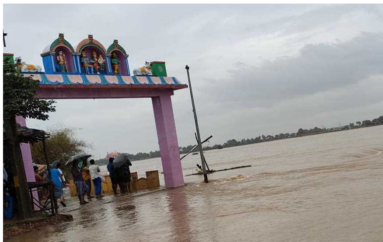
తిరుపతి జిల్లా సూళ్లూరుపేట టోల్ ప్లాజా సమీపంలోని గోకులకృష్ణ ఇంజనీరింగ్ కాలేజీ వద్ద కాళింగి నది ఉధృతంగా ప్రవహిస్తోంది. చెన్నై-కోల్కతా జాతీయ రహదారిపై నాలుగు అడుగుల మేర నీటిమట్టంతో వరద ప్రవహిస్తుండటంతో పోలీసులు రహదారిని మూసివేశారు. దీంతో రాకపోకలు నిలిచిపోయాయి. తిరుపతి జిల్లా శ్రీకాళహస్తి సమీపంలోని రాజీవ్ నగర్ వద్ద జగనన్న కాలనీలో ఇళ్ల మధ్య వరద నీరు ఏరులా మారింది.