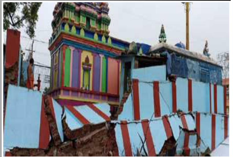
చీలురోడ్ వద్ద కూలిపోయిన రామాలయం ప్రహారీ గోడ..