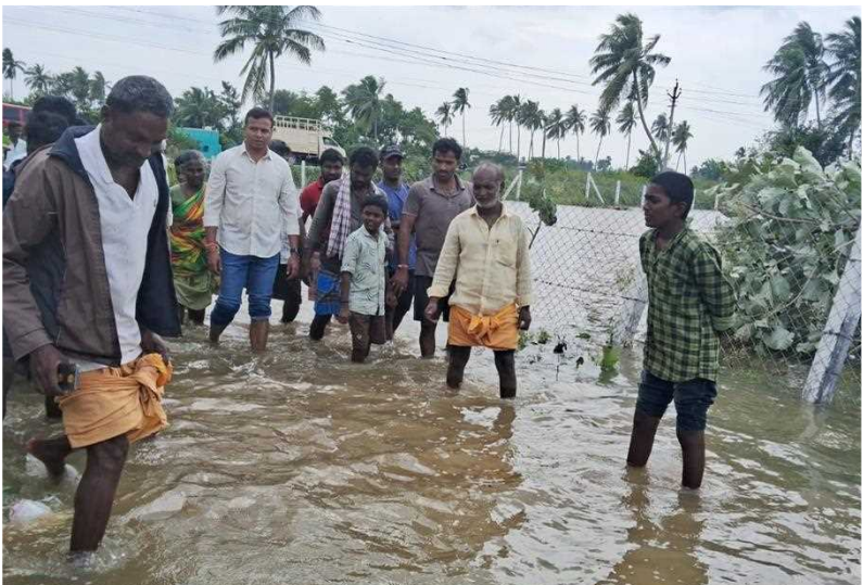
నగరి నిండ్ల మండలం బజి కండ్రిగిలో