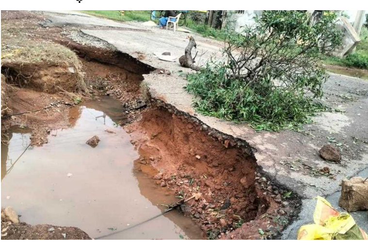
పశ్చిమ మధ్య బంగాళాఖాతంలో మిచౌంగ్ తీవ్ర తుఫాన్ ఎఫెక్ట్ రవాణా వ్యవస్థ పై భారీగా పడింది. వినమానయానం తో పాటు రైల్వే పై కూడా తుఫాన్ ప్రభావం పడింది. ఇప్పటికే పలు విమానాశ్రయాలు నీటితో నిండిపోవడం తో వైజాగ్ నుంచి వెళ్లే పలు విమానాలను అధికారులు రద్దు చేశారు. రైల్వే వ్యవస్థపై కూడా తుఫాన్ ఎఫెక్ట్ పడింది.

దీని కారణంగా సుమారు 150 రైళ్లు అధికారులు రద్దు చేశారు. మరెక్కొన్నింటిని దారి మళ్లించారు. కాచిగూడ- చెంగల్పట్టు, హైదరాబాద్-తాంబరం, సికింద్రాబాద్- కొల్లాం, సికింద్రాబాద్- తిరుపతి, లింగంపల్లి-తిరుపతి, సికింద్రాబాద్- రేపల్లె, కాచిగూడ- రేపల్లె, చెన్నై- హైదరాబాద్, సికింద్రాబాద్- గూడూరు, సికింద్రాబాద్-త్రివేంద్రం