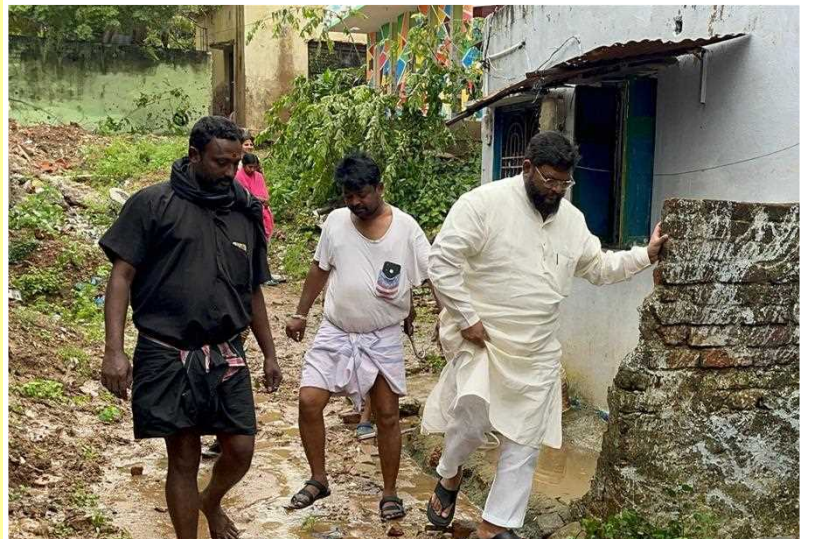
నెల్లూరు నగర నియోజకవర్గం 48వ వార్డులోని పార్కుకట్ట