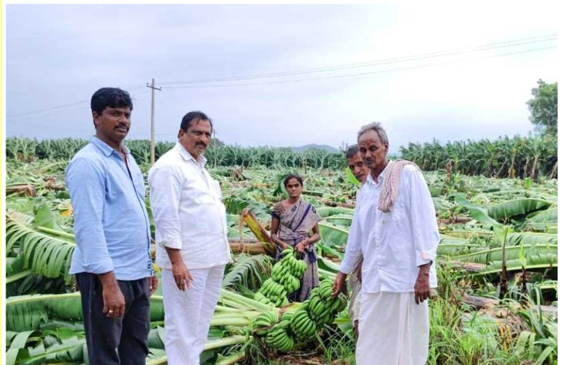
అన్నమయ్య జిల్లాలో సుమారు పదివేల ఎకరాలలో పంట నష్టం