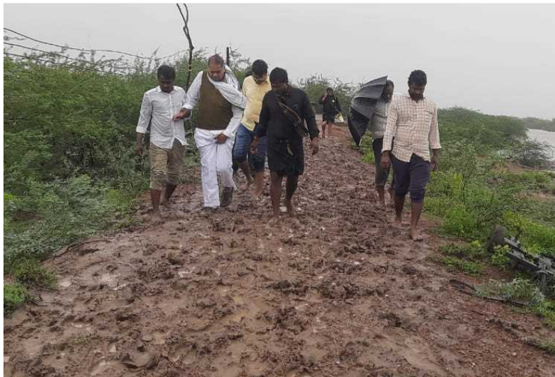
కోడూరు మండల శివారు పాలకాయ తిప్ప వద్ద కరకట్ట