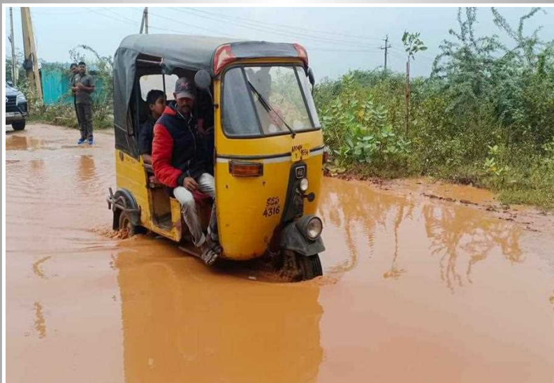
కడప నగరంలోని వైఎస్ఆర్ కాటనీ..