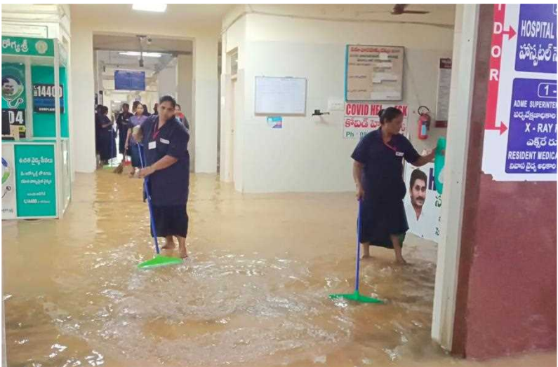
పలూరు ప్రభుత్వ ఆసుపత్రి వద్ద