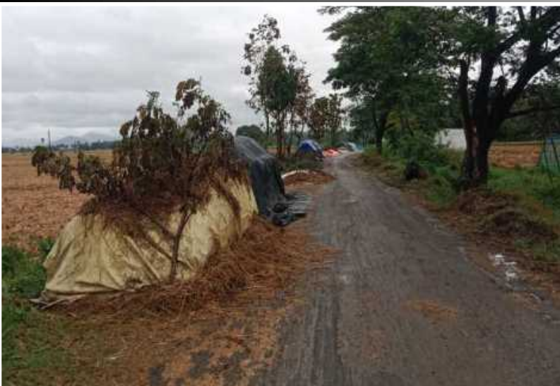
పశ్చిమ గోదవరి జిల్లా పోలవరంలో