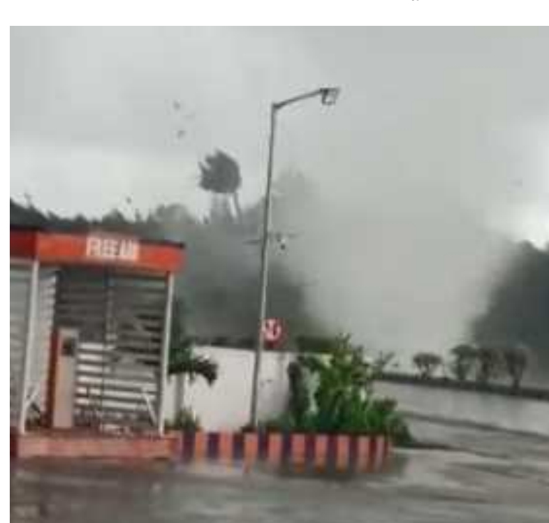
కాకినాడ: అమెరికాలో భూమిపై నుంచి ఆకాశం వరకు సుడులు తిరుగుతూ తీవ్ర విధ్వంసం సృష్టించే టోర్నడోల గురించి తెలిసిందే. తాజాగా, మిచౌంగ్ తీవ్ర తుఫాను వీటి తీరాన్ని అల్లకల్లోలం చేస్తున్న సమయంలో... కాకినాడ జిల్లాలో టోర్నడో తరహా సుడిగాలి బీభత్సం సృష్టించింది. గండేపల్లి మండలం మల్లేపల్లి వద్ద జాతీయ రహదారి పక్క నుంచి ఈ సుడిగాలి దూసుకువచ్చింది. రహదారిపై వెళుతున్న వాహనాలు నైతం ఈ సుడిగాలి ధాటికి కుదుపులకు లోనయ్యాయి. ఆ తర్వాత రహదారి దాటిన సుడిగాలి పెట్రోల్ బంకు పక్క నుంచి వెళుతూ సమీపంలోని కొబ్బరి తోటపైనా ప్రతాపం చూపించింది. సుడిగాలి ధాటికి కొబ్బరి చెట్లు చెల్లాచెదురయ్యాయి. సుడిగాలి ప్రచండవేగం చూసి స్థానికులు భయాందోళనలకు గురయ్యారు.