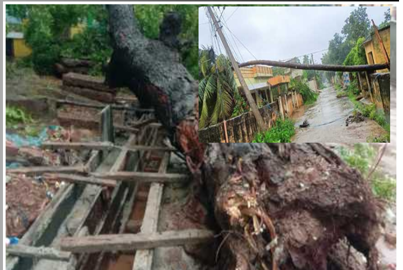
నెల్లూరు జిల్లా బోగోలులో రోడ్లపై విరివడ్ల చెట్లు, విద్యుత్ స్తంబాలు