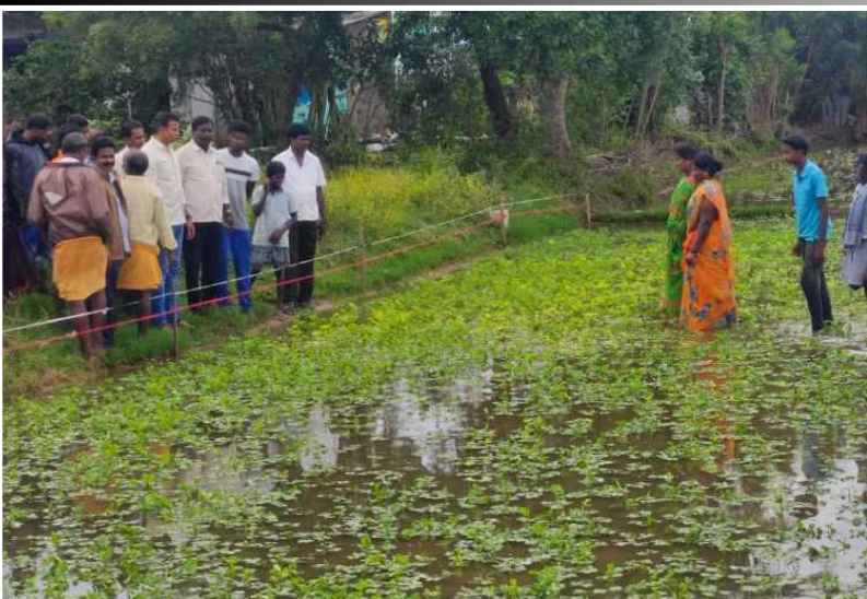
నగరలో నీట మునిగిన వేరుశనగ పంట