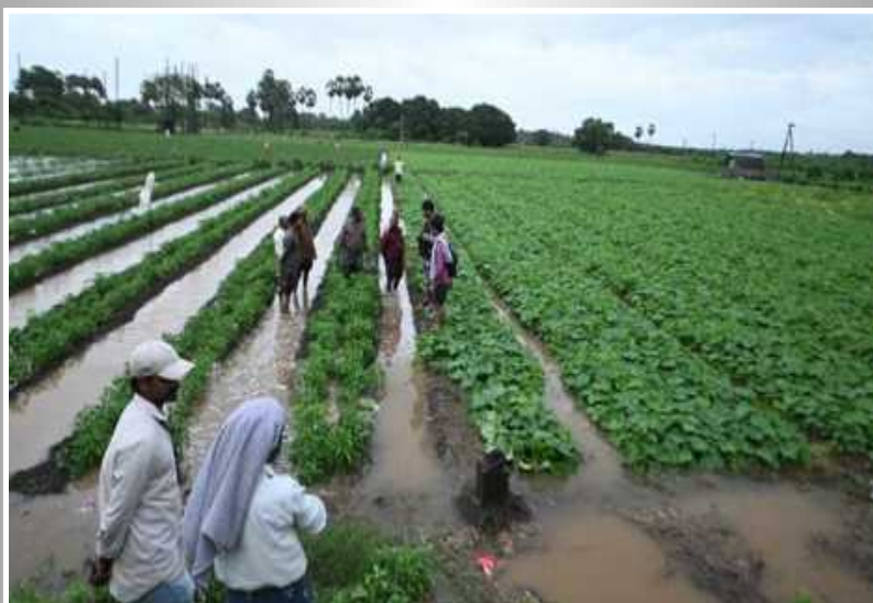
కర్లపాలెంలో నీట మునిగిన మిర్చి పంట