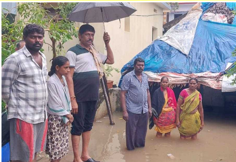
భీమవరం పట్టణం 34 వార్డు రజకులపేటలో