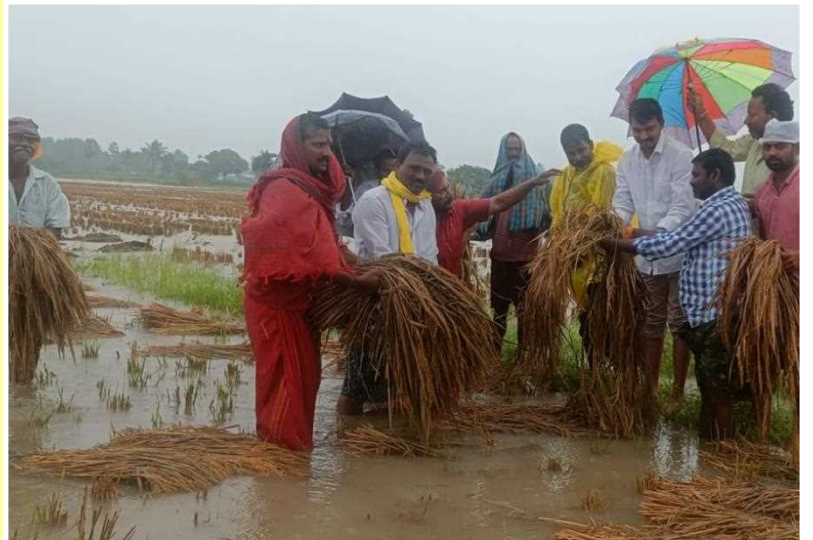
పెదన నియోజకవర్గంలో సాతులూరు ముసిగిన పంట పొలాలు