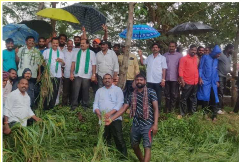
తుని తొండంగి మండలంలో దెబ్బ తిన్న వరి పంట