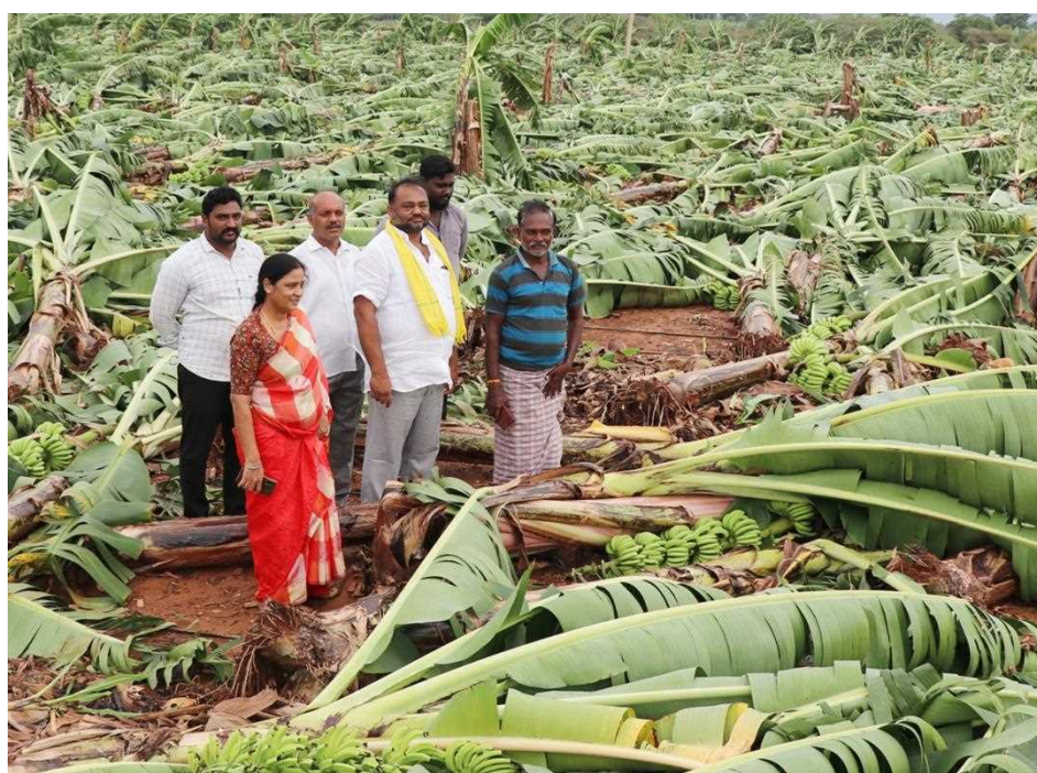
మొలకెత్తుతుందనే ఆందోళన వ్యక్తమవుతోంది.

కాలనీలు, జలమయమయ్యాయి. చేతికొచ్చిన వరిపంట రెండు రోజులుగా వర్షానికి తడుస్తూ వరి కంకులు బరువెక్కి వరిచేలు ఈదురుగాలులకు నేలమట్టమవుతున్నాయి. పడిపోయిన చేలపైకి వర్షం నీరు చేరడంతో అన్నదాతలు తీవ్ర ఆందోళన గురవుతున్నారు. ఇప్పటికే ఎకరాకి రూ. 30,000 వరకు పెట్టుబడి పెట్టిన రైతులకు పంటను గట్టుకు చేర్చుకునే తరుణంలో కురుస్తున్న వర్షాలతో తాము తీవ్రంగా నష్టపోతామని ఆవేదన వ్యక్తం చేస్తున్నారు. పాలకోడేరు, ఆకివీడు, కాళ్ళ, ఉండి, పాలకొల్లు, సరసాపురం, వీరవాసరం మండలాల్లో వరిచేలు వర్షాలకు దెబ్బతింటున్నాయి, ధాన్యం రాశులు అడుగుభాగానికి వర్షం నీరు చేరుతుండటంతో రైతులు నీటిని బయటికి పంపేందుకు చర్యలు చేపట్టారు.