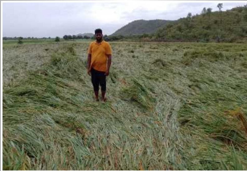
కడప జిల్లా కలసపాడులో