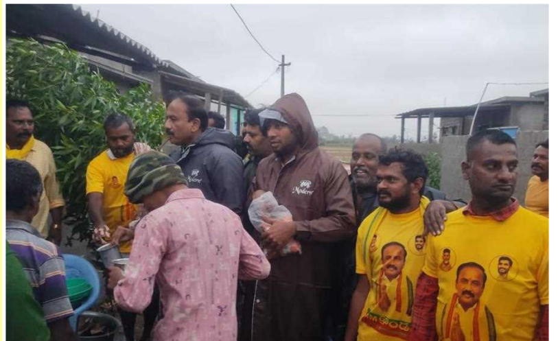
చీరాల అబ్దుల్ కలాం కాలనీలో పాలు, బిస్కెట్స్, భోజనం పంపిణీ