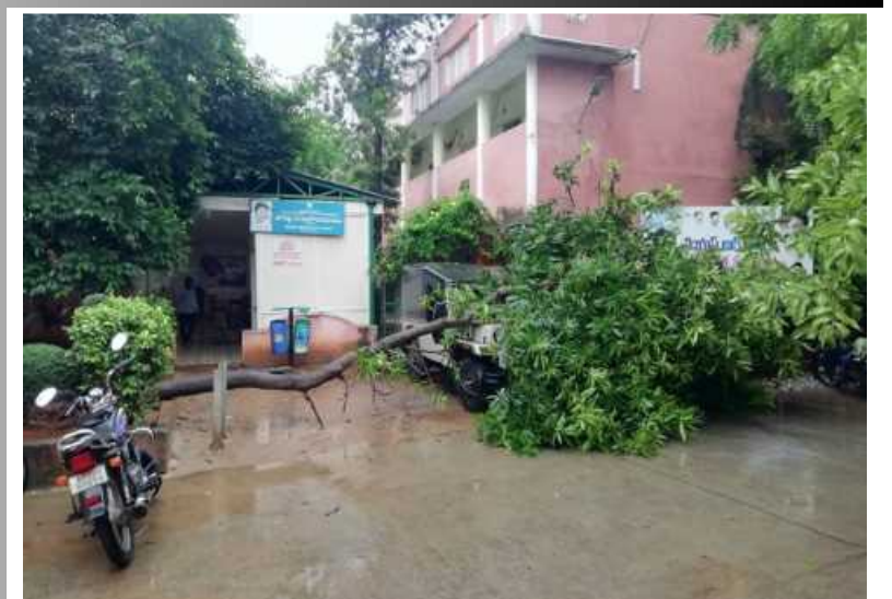
తెనాలి మున్సిపల్ కార్యాలయం వద్ద..