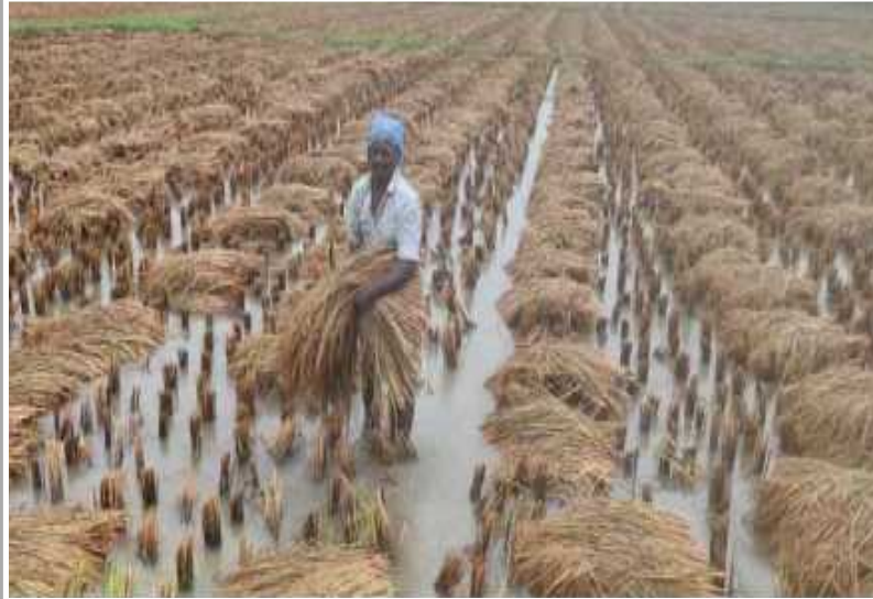
పశ్చిమ గోదవరి దెందూలురులో