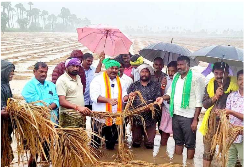
పెదపారుపూడి యలమర్తు గ్రామంలో దెబ్బ తిన్న పంట పొలాలు