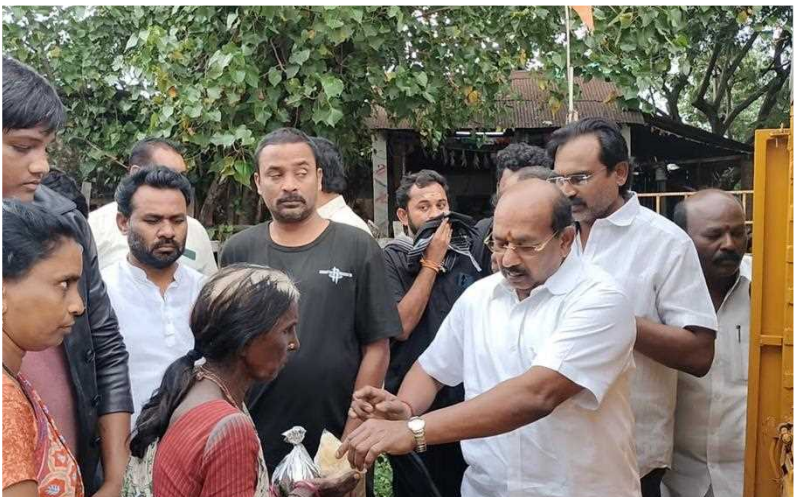
వెంకటగిరిలోని 8,10,12,13,22,24,25 వార్డుల్లో నిరాశ్రయమైన, నిరుపేదలకు భోజనం ప్యాకెట్లు పంపిణీ