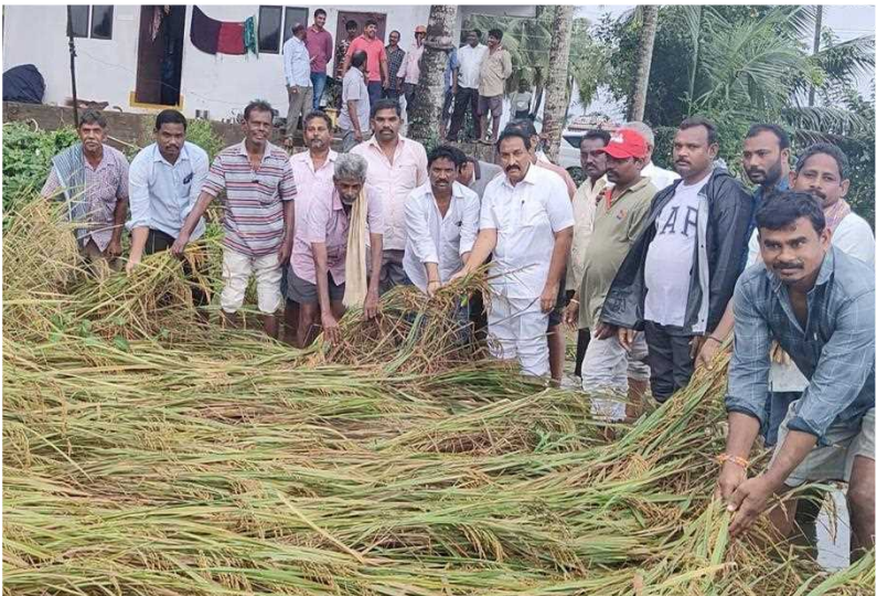
కోనసీమ జిల్లా కొత్తపేట శివారు చిన్నగూళ్ళపాలెంలో