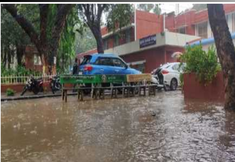
పశ్చిమ గోదవరి జిల్లాలో