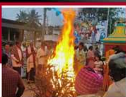
పవనీ వద్దిన కీడు తొంగిపోవాలని ధోగి మంటలు