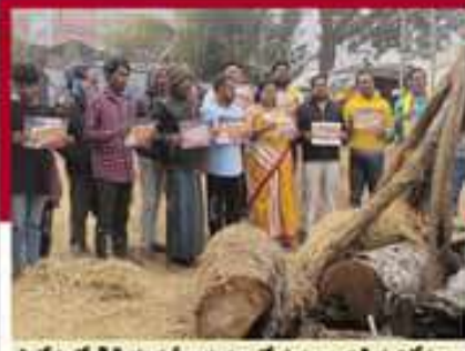
పాపేరులో గిద్ది తిక్కనర్ లద్దర్లంలో ప్రభుత్వానికి వ్యతిరేకంగా నివాసాలు చేస్తున్న జీవోలు రహితం చేస్తున్న ఉత్తం