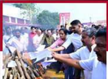
చంద్రగిరిలో జివోలు భోగిమంటల్లో వేస్తున్న చిత్రం