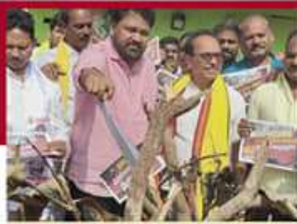
విద్వాలపేటలో ముద్దుల జివోలు దగ్ధం చేస్తున్న చిట్టి శార్వార్యలు, నాయకులు