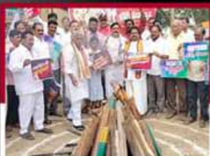
బాగంపేటలో లోగి మంటలో ప్రభుత్వ జీవోలు దగ్ధం చేస్తున్న త్రిపురం సెన్ట్రలు, కార్యకర్తలు