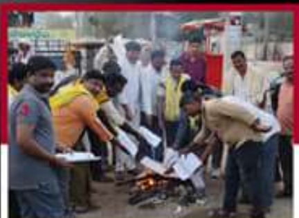
అదోనిలో మినాక్సీనాయుడు అధ్యక్షులలో ప్రభుత్వ జీవోలు దహనం చేస్తున్న కార్యకర్తలు