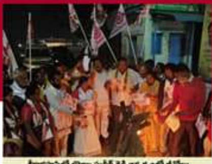
శ్రీకాళహస్తిలో బొగ్గాల మట్టి రిఫ్ట్ అధ్యక్షులతో జేపీఐ ధోగి మంటల్లో చేస్తున్న జీడీఎం, జనతా వేతలు