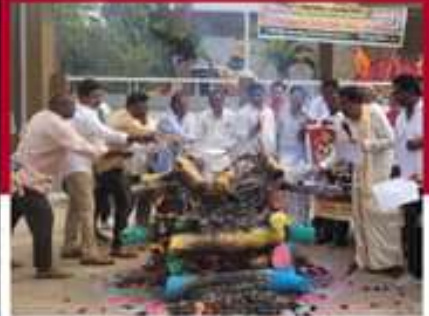
కొత్తూరులో బండారు నర్సారెండరావు అధ్యక్షులు