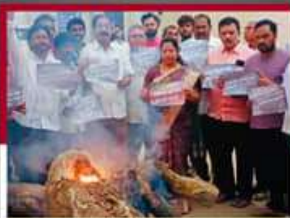
కాకినాడ జిల్లా ప్రత్తిపాడులో తరువుల సత్యప్రసాద్ అద్దర్లంలో లోగి మంటలో జీవోలు వేస్తున్న కార్యకర్తలు