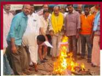
పంటాల శ్రీరామ్ ఆలేఖాల్ దర్శనంలో ధోగి మంటల్లో ప్రభుత్వ జేపీఐ దర్శం చేస్తున్న ఉత్తం