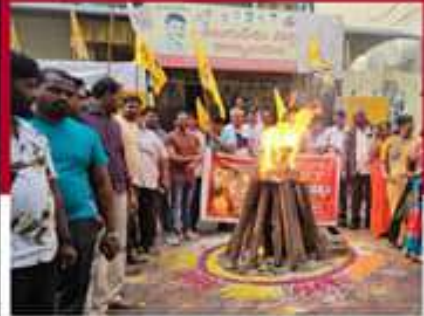
విజయవారి ఎక్స్ కుమ నియోజకవర్గంలో జీవోల దగ్ధం