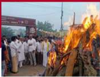
తిరువనంతో జేపీఐ దర్శం చేస్తున్న నాయకులు, కార్యకర్తలు