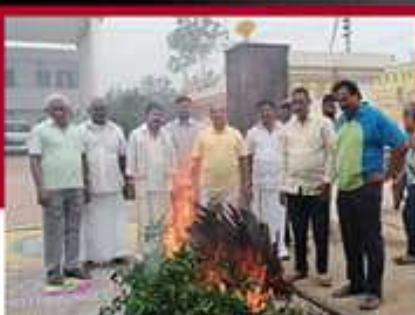
వెంకటగిరి పట్టణంలో జీవోలు దహనం చేస్తున్న కురుగొండ