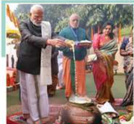
సంస్థాపక సంబంధాల్లో పంచె కట్టిన ప్రధాని