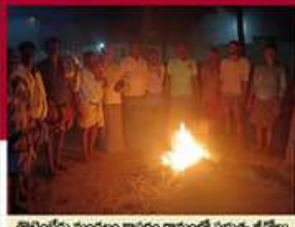
తొట్లంబేడు మండలం కాపరం గ్రామంలో ప్రభుత్వ జేపీఐ దర్శం చేస్తున్న జీడీఎం కార్యకర్తలు