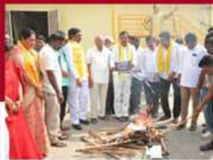
కర్నూలులో జీవో నాయకులు అద్దర్లంలో జీవోల దగ్ధం