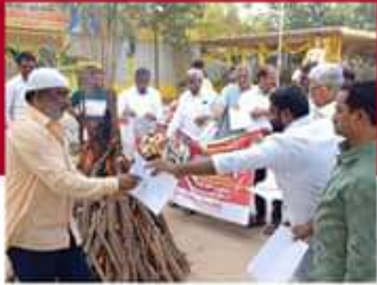
అన్నారంలో ప్రభుత్వ జీవోలు రహితం చేస్తున్న కార్యకర్తలు