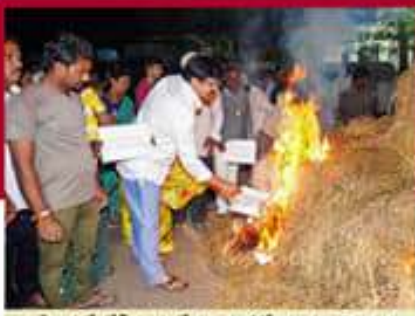
గుడివాడలో లోగి మంటల్లో ప్రభుత్వ జీవోలను తగలదీయటాన్ని నియోజకవర్గ టీడీపీ జనీషాన్ వెంకట్రాజు రామ