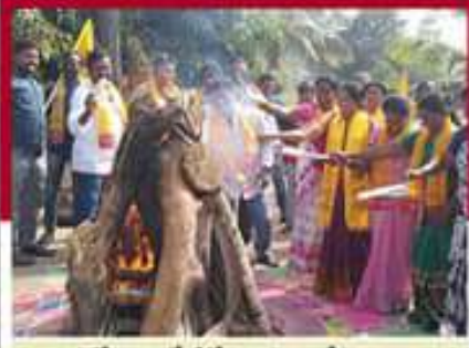
రంపచోరవరంలో జీవోలు రహితం చేస్తున్న వంశం రాజేశ్వర్ శంకరరతులు