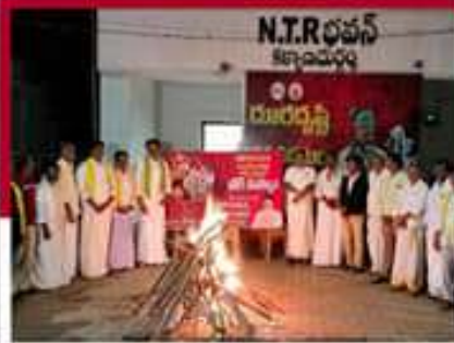
కొక్కానూరులో ప్రభుత్వ జీవోలు మంటల్లో వేస్తున్న చిత్రం