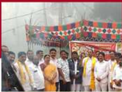
పెగడవరం అంలాజీటిలో టీడీపీ శ్రేణుల ఆందోళన