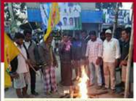
తంబళ్లపల్లిలో జేపీఐ మంటల్లో చేస్తున్న దృశ్యం