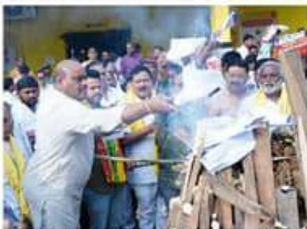
అవధానం (వైఎస్సార్) కేసు కొలగారే... ఏపీ వెలగారి అంటూ రాష్ట్ర వ్యాప్తంగా తెలుగుదేశం - అసనీ ప్రజలు భోగి వేడుకలు నిర్వహించారు.

అవధానం (వైఎస్సార్) కేసు కొలగారే... ఏపీ వెలగారి అంటూ రాష్ట్ర వ్యాప్తంగా తెలుగుదేశం - అసనీ ప్రజలు భోగి వేడుకలు నిర్వహించారు. భోగి సందర్భంలో అగణం వైసీపీ ప్రభుత్వం తీవ్రంగా ప్రతిఘటించి భోగి వేడుకలు నిషేధించింది. అసనీ ప్రజలు అందుకు వ్యతిరేకంగా భోగి వేడుకలు నిర్వహించారు. భోగి వేడుకలు నిర్వహించే సందర్భంగా అసనీ ప్రజలు అందుకు వ్యతిరేకంగా భోగి వేడుకలు నిర్వహించారు.