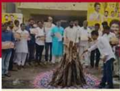
పొద్ది శ్రీనివాసో కరణ ప్రభుత్వ జీవోలను దగ్ధం చేస్తున్న కోలార రాజులారులు