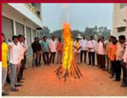
ధోన్ లో దర్శనం సుబ్బారెడ్డి అధ్యక్షులతో శ్రేణుల నిరసన