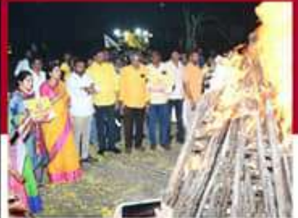
విజయవాడ తూర్పు నియోజకవర్గంలో జీవోలు దగ్ధం