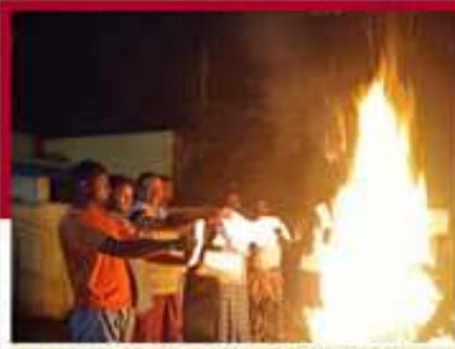
సన్కమేడులో జేపీఐఐఐ దర్శం చేస్తున్న కార్యకర్తలు