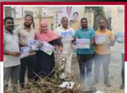
రైల్వేకోడూరులో ప్రభుత్వ జీవోలు దగ్ధం చేస్తున్న కార్యకర్తలు