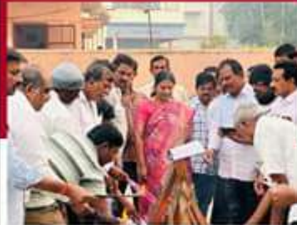
బండగామలో తంగిలాల సొమ్మ అధ్యక్షులలో లోగి మంటలు