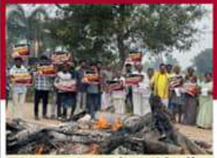
మాడుగుల నియోజకవర్గంలో ప్రభుత్వ జీవోలు లోగి మంటల్లో వేస్తున్న టీడీపీ నాయకులు, కార్యకర్తలు