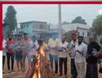
జంగారెడ్డిగూడెంలో ధోగి మంటల్లో జేపీఐ దర్శం