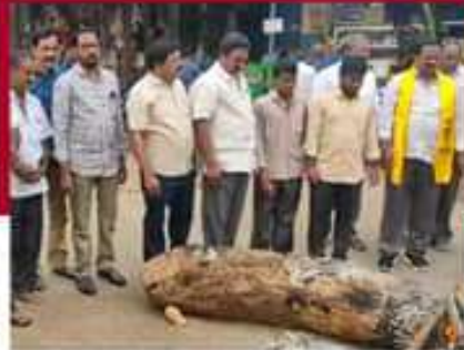
సామర్లకోటలో భోగి మంటలు