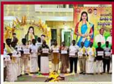
శివగమలంలో బండారు శ్రావణ్ శ్రీ అధ్యక్షులతో ధోగి మంటల్లో జేపీఐ దర్శం చేస్తున్న ఉత్తం