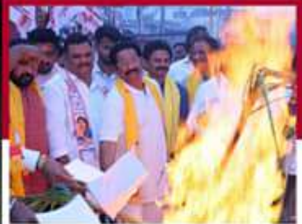
బిమలినందల్లో జేపీఐ అధ్యక్షులతో జేపీఐ దర్శం