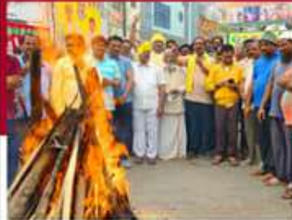
లోగి మంటలో జీవోలు వేస్తున్న వరసరావులకు నేతలు