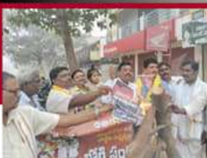
వర్సినట్లంలో జీవోలు దగ్ధం చేస్తున్న నాయకులు