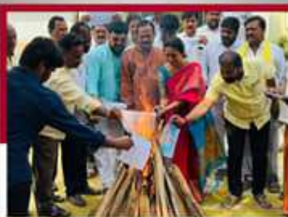
పొద్దుతిమ్మలో పొద్ది శ్రీనివాసో కరణ ప్రభుత్వ జీవోలను దగ్ధం చేస్తున్న గౌరు చలంశెట్టి రంపకరతులు