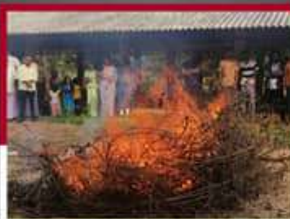
పూతలపట్టణంలో లోగి మంటలు వేసి ప్రభుత్వ జీవోలు దగ్ధం చేస్తున్న కార్యకర్తలు