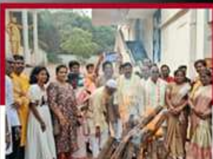
లోగి మంటలో జీవోలు వేస్తున్న గంటి బాద్ది, శంకరరతులు