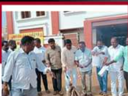
మండలంలో జీవోలు రహితం చేస్తున్న ఉత్తం