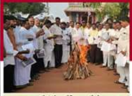
రాయదుర్గంలో జీవోలు లోగి మంటల్లో వేసే విధానం తెలుపుతూ మాజీమంత్రి కాలవ శ్రీనివాసులు శరణులు