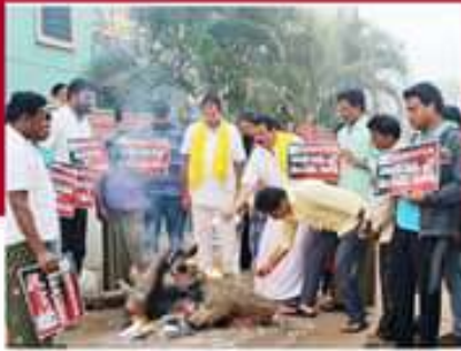
దివలపూడిలో జీవోలు దగ్ధం చేస్తున్న చిత్రం