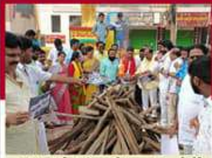
అంబులూరులో గన్న వీరాంజనేయలు అద్దర్లంలో లోగి మంటలో ప్రభుత్వ జీవోలు వేస్తున్న కార్యకర్తలు