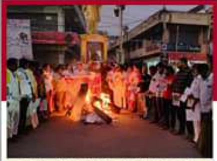
గుంతకల్లులో ప్రభుత్వ జేపీఐ దర్శం చేస్తున్న కార్యకర్తలు