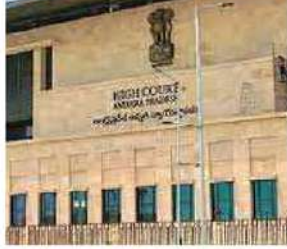
విచారణార్హతపై ఫిబ్రవరి 12న వాదనలు వింటామని స్పష్టం చేసింది..

ఆమరావతి: వైసీపీ ప్రభుత్వ విధానాలపై సీబీఐ విచారణకు ఆదేశించాలని కోరుతూ ఎంపీ రఘురామ కృష్ణారాజు దాఖలు చేసిన పిల్పై విచారణను ఏపి హైకోర్టు ఫిబ్రవరి 12కి వాయిదా వేసింది. ఈలోపు వ్యాజ్యం విచారణ అర్హతపై కోంటర్ దాఖలు చేసేందుకు ప్రతివాదులకు వెనుకబాటు అందింది. కౌంటర్పై రిపై వేయాలని పిటిషనర్ కు హైకోర్టు ఆదేశాలు జారీ చేసింది. పిల్