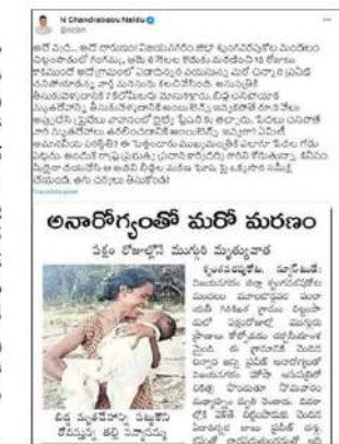
ఒక్కసారి సమీక్ష చేయండి. తగుచర్యలు తీసుకోండి! అంటూ చంద్రబాబు పేర్కొన్నారు.

అదే వ్యధ... అదే దారుణం! విజయనగరం జిల్లా శృంగవరపుకొల మండలం చిట్టంపాడులో గుంమ్మ, అమె (నెలల కొడుకు మరణించి 15 రోజులు కాకముందే అదే గ్రామంలో ఏడాదిన్నర వయసున్న మరో చిన్నారి ప్రవీణ్ చనిపోయాడన్న వార్త మనసును కలచివేసింది. ఆసుపత్రికి తీసుకువెళ్ళడానికి 7 కిలోమీటర్లు దోలీపై మోసుకెళ్ళారు. బిచ్చ చనిపోయాక మృత దేహాన్ని తీసుకువెళ్ళడానికి అంబులెన్స్ ఇవ్వకపోతే రూ.3 వేలు అప్పచేసి డ్రైవేలు వాహనంలో రైల్వేస్టేషన్ తెచ్చారు. పేదలు చనిపోతే వారి మృతదేహాలు తరలించడానికి అంబులెన్స్ ఇవ్వరా? ఏమిటి అనూనవీయ చర్యితి? ఈ పెత్తందారు ముఖ్యమంత్రికి ఎలాగూ పేదల గోడు పట్టదు. అందుకే రాష్ట్ర ప్రభుత్వ ప్రధాన కార్యదర్శి (సీఎస్)ని కోరుతున్నా కనిసం ఛీరెనా దయచేసి ఆ అదవి చిట్టంపాడు మరణ ఘోషపై