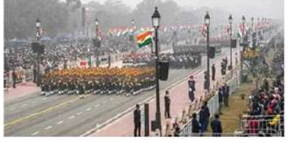
న్యూఢిల్లీ : గణతంత్ర దినోత్సవ వేడుకల సేవల్లో డేజ్ రాజధాని ఢిల్లీలో పోలీసులు పటిష్ఠ బందోబస్తు ఏర్పాటు చేశారు.

రిపబ్లిక్ డే వేడుకలు నిర్వహించే కర్తవ్య పథ పరిసరాల్లో 14 వేల మంది పోలీసులతో భద్రత ఏర్పాటు చేసినట్లు ఢిల్లీ పోలీసులు తెలిపారు. ఈ వేడుకలకు 77 వేల మంది అతిథులు హాజరయ్యే అవకాశం ఉందని సీఐఎస్ గాఢంగా భావిస్తున్నారు. రిపబ్లిక్ డే వేడుకల సేవల్లో ఢిల్లీని 28 జోన్లుగా విభజించామని చెప్పారు. ఈ జోన్లలో పోలీసు ఉన్నతాధికారులు పర్యవేక్షణ చేస్తారని తెలిపారు. ఇక హెల్మెట్ డెవలప్ మెంట్, ప్రాథమిక దిశానిర్ణయ కేంద్రాలను ఏర్పాటు చేసినట్లు సీఐఎస్ గాఢంగా భావిస్తున్నారు. గణతంత్ర దినోత్సవానికి హాజరయ్యే అతిథులు సమయానికి చేరుకోవాలని, పోలీసులకు సహకరించాలని కోరారు. చైక్ పాయింట్ల వద్ద ప్రతి వాహనాన్ని తనిఖీ చేస్తామన్నారు.