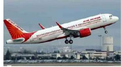
ఎయిర్ ఇండియా సంస్థకు డీజీసీఏ పైనే వేసింది. పైలట్లు రోస్టరింగ్ నిబంధనలు ఉల్లంఘించినందుకు గానూ ఎయిరిండియాకు రూ.30 లక్షల జరిమానా వేసింది.

ఢిల్లీ: ప్రముఖ విమానయాన సంస్థ ఎయిర్ ఇండియాకి డైరెక్టరేట్ జనరల్ ఆఫ్ సివిల్ ఏవియేషన్ మరోసారి షాక్ అచ్చింది. భద్రతకు సంబంధించిన నిబంధనలు ఉల్లంఘించినందుకు గానూ భారీ జరిమానా విధించింది. ఎయిర్ ఇండియా ఉద్యోగి నుంచి అందిన ఫిర్యాదు మేరకు డీజీసీఏ చర్యలకు ఉపక్రమించింది. ఈ మేరకు రూ.1.10 కోట్ల భారీ జరిమానా వధించింది. నిర్దిష్ట సూచక ప్రాంత క్షిప్తమైన మార్గాల్లో నిర్వహించే విమానాల విషయంలో ఎయిర్ ఇండియా సంస్థ భద్రతా నిబంధనలను ఉల్లంఘించిందని ఆ సంస్థలోని ఓ ఉద్యోగి ఫిర్యాదు అందించినట్లు డీజీసీఏ తెలిపింది. ఆ ఫిర్యాదుపై సమగ్ర దర్యాప్తు చేపట్టినట్లు వెల్లడించింది. ఈ మేరకు సంస్థకు భారీ జరిమానా విధించినట్లు స్పష్టం చేసింది. కాగా, ఎయిర్ ఇండియాకు డీజీసీఏ జరిమానా విధించడం వారల్లో ఇది రెండోసారి. గత గురువారం కూడా