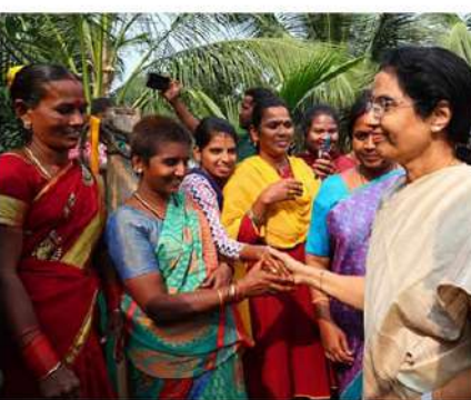
ధైర్యం చెప్పిన వారికి కృతజ్ఞతలు తెలుపుతూ ముందుకు సాగారు.