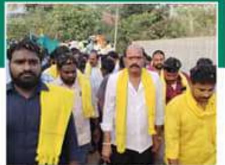
జగన్ ను తరిమికొట్టాలి... మనకు మంచి లోకాలు వచ్చేయాలి... టీడీపీ రాష్ట్ర అచ్చెన్నాయుడు బాబు షూటింగ్ భవిష్యత్తును విజయవంతం చేసినందుకు మనకు మంచి లోకాలు వచ్చేయాలి...