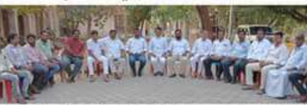
పుట్టువల్లలే జయహింస టీసీ కార్యక్రమం... పాల్గొన్న సులుపురు నేతలు

పుట్టువల్లలే జయహింస టీసీ కార్యక్రమం... పాల్గొన్న సులుపురు నేతలు... టీడీపీ హయాంలోనే బీసీలకు పెద్ద పీట