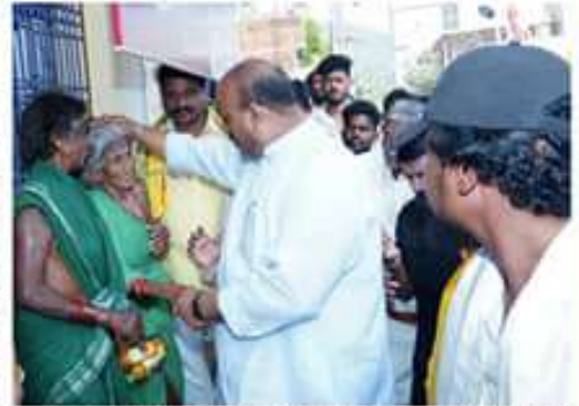
జగన్ ను తరిమికొట్టాలి... టీడీపీ రాష్ట్ర అచ్చెన్నాయుడు బాబు షూటింగ్ భవిష్యత్తును విజయవంతం చేసినందుకు మనకు మంచి లోకాలు వచ్చేయాలి...