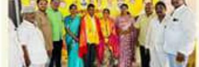
మహిళా శక్తి పథకం అభివృద్ధి కోసం జరిగిన సమావేశం

అతని పాతకాలే తెలుగు ప్రజలకు తెలియాలి. అతని పాతకాలే తెలుగు ప్రజలకు తెలియాలి. అతని పాతకాలే తెలుగు ప్రజలకు తెలియాలి. అతని పాతకాలే తెలుగు ప్రజలకు తెలియాలి.