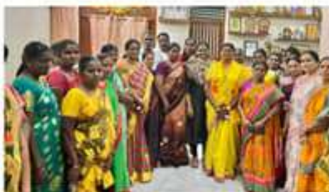
రాష్ట్ర తెలుగు మహిళా ప్రజల అభివృద్ధి కోసం జరిగిన సమావేశం

రాష్ట్ర తెలుగు మహిళా ప్రజల అభివృద్ధి కోసం జరిగిన సమావేశం. అతని పాతకాలే తెలుగు ప్రజలకు తెలియాలి. అతని పాతకాలే తెలుగు ప్రజలకు తెలియాలి. అతని పాతకాలే తెలుగు ప్రజలకు తెలియాలి.