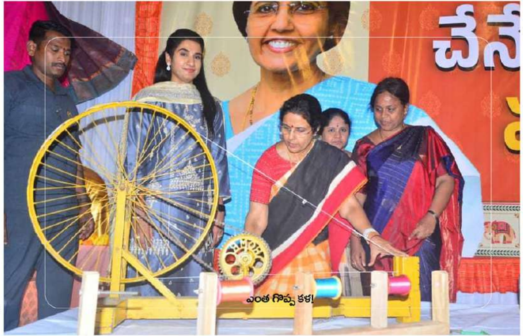
ఎంత గొప్ప కళ!

-ధర్మవరం చేనేత మహిళలతో ముఖామఖిలో భువనేశ్వరి.