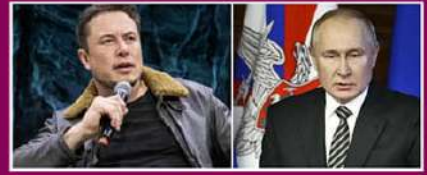
- అలన్ మస్క్ సంచలన వ్యాఖ్యలు

వాషింగ్టన్, ఉక్రెయిన్లో యుద్ధాన్ని కొనసాగించడాని రష్యా అధ్యక్షుడు పుతిన్ పైన చాలా ఒత్తిడి ఉందని, ఒక వేళ ఆ యుద్ధంలో ఓడినా, యుద్ధాన్ని ఆపినా పుతిన్ ను హతమారుస్తారని డిస్కో, స్పేస్ ఎక్స్ వ్యవస్థాపకుడు అలన్ మస్క్ సంచలన వ్యాఖ్యలు చేశారు. ఉక్రెయిన్లో యుద్ధంలో రష్యా ఎక్స్ పర్టికల్టర్ల మా ఒడిపోదని అన్నారు. తన ప్రాణానికి ప్రమాదం ఉండడంతో గెలిచేంత వరకు పుతిన్ యుద్ధాన్ని కొనసాగిస్తానని ఓంటారు అన్నారు. 'ఎక్స్ స్పేస్'ను బేదిత్వ రిట్యుజ్ పార్టీ ప్రతినిధులతో జరిగిన చర్చలో మస్క్ ఈ ఆశీస్రాయాలను వెలిబుచ్చారు. తన ఈ వ్యాఖ్యలు నెట్ వర్క్ లో చాలా మంది తనను విమర్శిస్తున్నారని, కానీ వాస్తవాల తెలుసుకొని మాట్లాడాలని అన్నారు. ఉక్రెయిన్లో రష్యా ఒడిపోయే అవకాశమే లేదని, అలాగే యుద్ధంలో గెలవాలని ఉక్రెయిన్ ఆరోపించడం మూర్ఖత్వమే అవుతుందని, ఏకైక కాలం యుద్ధాన్ని కొనసాగిస్తే ఉక్రెయిన్ కు భారీ నష్టం జరిగే అవకాశముందని చెప్పారు. యుద్ధంలో తాము ఉక్రెయిన్ వైపునే ఉన్నామని, అయితే రెండు వైపుల ప్రాణ నష్టం జాలని తాము కోరుకుంటున్నట్లు చెప్పారు. రష్యాను అణగారేక్కడానికి తమ కంపెనీ చేసినట్లుగా మరో కంపెనీ చేయలేదని చెప్పారు. రష్యా అంతర్గత ప్రాజెక్టుల నుండి తాము తప్పుకుంటున్నట్లు గుర్తు చేశారు. అలాగే ఉక్రెయిన్ కు స్ట్రోగ్ లింక్ సరికొరతను అందిస్తున్నామని, ఉక్రెయిన్ కు యుద్ధంలో ఇది చాలా ఉపయోగపడుతుందని చెప్పారు.