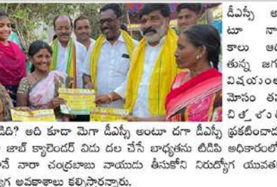
వీటికి ఆది కూడా మేగా డీఎన్యే అంటూ దా దీఎన్యే ప్రకటించారు. ఏటా జూబ్ క్యాలెండర్ విడుదల చేసే భార్యకు టీడీపీ అధికారంలోకి రాగానే వారా చంద్రబాబు నాయుడు తీసుకోసాగి నిరుద్యోగ యువతకు ఉద్యోగ అవకాశాలు కల్పిస్తారన్నారు.