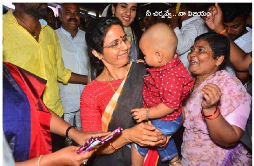
నీ చిర్కవేష్టే.. నా విజయం