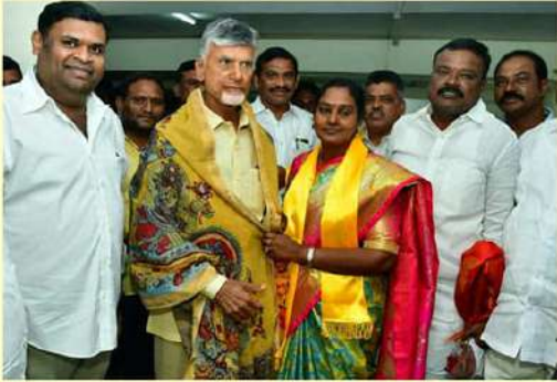
చంద్రబాబు సమక్షంలో టీడీపీలో చేరిన ముగ్గురు జడ్పీటీసీలు, నేతలు