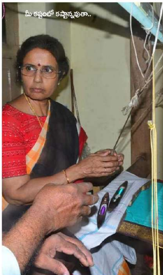
మీ కళ్ళంలో కష్టాన్నవుతా..