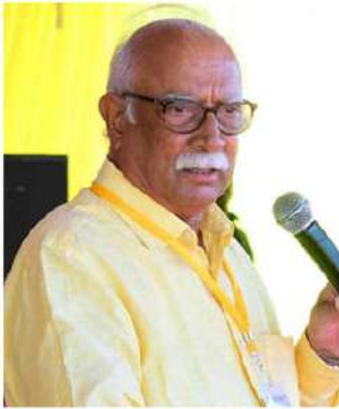
అడికి దూరంచేసిన వ్యక్తి జగన్ హోమ్ రెడ్డి. మరో సారి ఈ సీఎంపి అవకాశం ఇస్తే దేశంలోనే అత్యధిక నిరక్షరాస్యుల ఉన్న రాష్ట్రంగా ఏపీని నిలబెడతారు. సైకో ముఖ్యమంత్రి పాలనలో పోలవరం