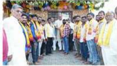
వరంగం కృషి పార్టీని పార్టీలో చేరిన వారు తెలిపారు. ఆ కార్యక్రమంలో ముఖ్యమంత్రి టీడీపీ నేతలు, కార్యకర్తలు పాల్గొన్నారు.

వక్రం (వైశ్యవర్ణం): టీడీపీ ప్రభుత్వంలోని సంక్షేమం, అభివృద్ధి పాత్రను ప్రజలకు తెలియజేయడానికి రాష్ట్ర అభివృద్ధి కమిషన్ అధ్యక్షుడు అచ్చెన్నాయుడు వ్యాఖ్యానించారు. ఒక్కొక్క అంశం అధికారంలోకి వచ్చిన అభివృద్ధి పాత్రను సర్దుబాటు చేశారు. ముఖ్యంగా సంకల్పశీల మండలం కోటపాడు, పాడుకుండుపాడుకు పేటకు చెందిన ముఖ్యమంత్రి వైసీపీ కార్యకర్తలు అచ్చెన్నాయుడు సమక్షంలో టీడీపీలో చేరారు. వారికి అమెస్ పార్టీ కండువా కట్టి ఆహ్వానించారు. ఆ సందర్భంగా అచ్చెన్నాయుడు మాట్లాడుతూ... రాష్ట్రాభివృద్ధిని విస్తరించడం వైసీపీ పాత్రను బోధించడం... రాజకీయంగా అచ్చెన్నాయుడు వ్యాఖ్యానించారు. రాష్ట్రంలో అభివృద్ధి ఎక్కడోకే గానీ అక్కడే అభివృద్ధిని ఉంచాలి. పేదల జీవితాల్లో అభివృద్ధిని తెచ్చాలి. అభివృద్ధిని తెచ్చాలి. అభివృద్ధిని తెచ్చాలి. అభివృద్ధిని తెచ్చాలి. అభివృద్ధిని తెచ్చాలి.