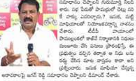
అధికారంపై జగన్ రెడ్డి సమాధానం చెప్పాలని డిమాండ్ చేశారు.