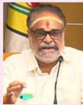
అప్పుడు కేసులతో వెలుగుతున్నామనగా ఎదుర్కోలేక అప్పుడు కేసులతో వెలుగుతున్నామనగా...