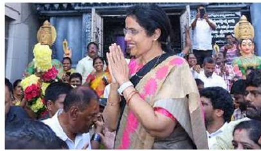
సాగింది. అరకు, పాడేరు, చోడవరం, యలమంచిలి నియోజకవర్గాల్లో నాలుగు రోజుల్లో 16మంది కార్యకర్తల కుటుంబాలను భువనేశ్వరి పరామర్శించారు. ఆరవ తేదీ 1, పాడేరులో 4, చోడవరంలో 4, యలమంచిలి నియోజకవర్గంలో 7 కుటుంబాలను కలిసి, ధైర్యం చెప్పి ఆర్థిక సాయం అందజేశారు.

విశాఖ(చైతన్యరథం): ఉమ్మడి విశాఖ జిల్లాలో భువనేశ్వరి నిజం గెలవాలి పర్వటన శుక్రవారం ముగిసింది. స్పీచ్ దివె అవెమెంట్ కేసులో టీడీపీ అధినేత చంద్రబాబు అక్రమ అరెస్టును తట్టుకోలేక మనస్తాపానికి గురై మృతి చెందిన పార్టీ కార్యకర్తల కుటుంబాలను ఓదార్చి, ఆర్థిక సాయం అందించేందుకు భువనేశ్వరి నిజం గెలవాలి పేరుతో రాష్ట్ర వ్యాప్తంగా పర్యటిస్తున్న విషయం తెలిసింది. ఇందులో భాగంగా 9వ విడత నిజం గెలవాలి పర్వటన అరకు, అనకాపల్లి పార్లమెంటు నియోజకవర్గాల్లో నాలుగు రోజుల పాటు