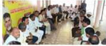
బడుగు బలహీన వర్గాలను అట్టడుగుకు తొక్కేసిన జగన్మోహన్ రెడ్డి