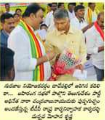
సమస్యలను పరిష్కరించడానికి ప్రయత్నించిన అనంతం ఓటింగ్ అప్పుడే ప్రారంభమైంది. అనంతం ఓటింగ్ అప్పుడే ప్రారంభమైంది.

అనంతం ఓటింగ్ అప్పుడే ప్రారంభమైంది. అనంతం ఓటింగ్ అప్పుడే ప్రారంభమైంది. అనంతం ఓటింగ్ అప్పుడే ప్రారంభమైంది. అనంతం ఓటింగ్ అప్పుడే ప్రారంభమైంది.