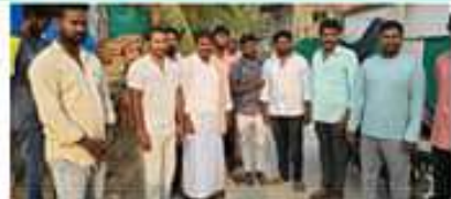
పల్లె ప్రగతిని పరుగులు పెట్టిద్దాం

పాపిర్రు (వైకేసీ): పల్లె ప్రగతిని పరుగులు పెట్టిద్దాం అంటూ పిలుపునిచ్చారు. పల్లె ప్రగతిని పరుగులు పెట్టిద్దాం అంటూ పిలుపునిచ్చారు. పల్లె ప్రగతిని పరుగులు పెట్టిద్దాం అంటూ పిలుపునిచ్చారు.