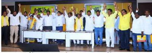
5న జరిగే టీసీ మహాసభకు సంఘీభావం తెలుపుతున్న టీసీ నాయకులు