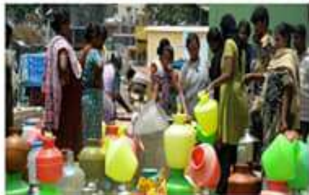
480 మెయిన్ లీన్స్ నీరు

బెంగళూరు: బీజేపీ పార్టీ బెంగళూరులో తీవ్ర నీటి కొరకే వెళ్ళింది. మంచి నీటి కోసం అందరి ముందుగా బెంగళూరులోని బెంగళూరు నుండి బ్యాంకుల్లో వచ్చి నీటిని తీసుకువచ్చారు.