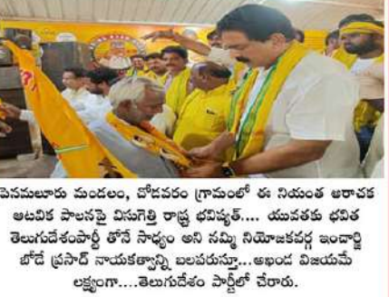
పెనమలూరు మండలం, బోడవరం గ్రామంలో ఈ నియంత ఆరాచక అలవిత పాలనపై విసగిరి రాష్ట్ర భవిష్యత్... యువతకు భవిత తెలుగుదేశంపార్టీ తోనే సాధ్యం అని సమస్య నియోజకవర్గ అండ్ టోడే ప్రసాదీ నాయకత్వాన్ని బలపరుస్తూ... ఆంధ్రం విజయమే లక్ష్యంగా... తెలుగుదేశం పార్టీని పేదరించారు.