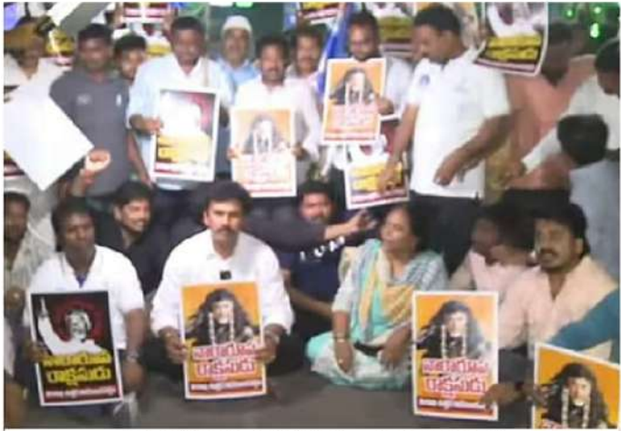
దాడి జరిగిన నిమిషాల వ్యతిరేక వ్యకారులు ఎక్కడ మండి వచ్చాయి? ఇది ముందస్తు కట్టల కాదా?

వైసీపీ కుట్ర రాజకీయాల్ని ప్రజలు అసహ్యించుకుంటున్నారని