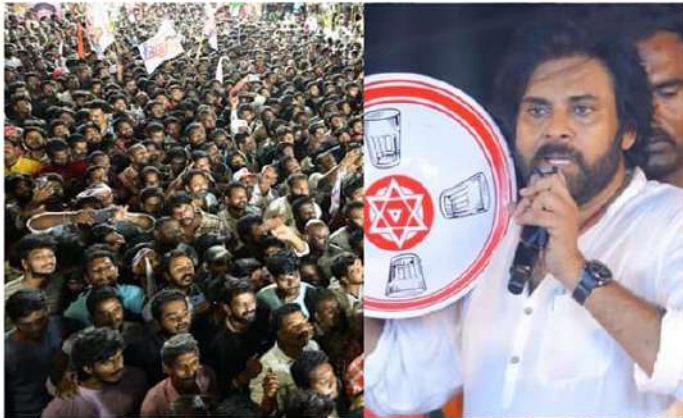
ఓడిపోయా ఈ రోజు మీముందు నిలబడ్డానంటే దానికి కారణం మీరు చూపించిన ప్రేమ, అభిమానాలే అని పవన్ కళ్యాణ్ వ్యాఖ్యానించారు.