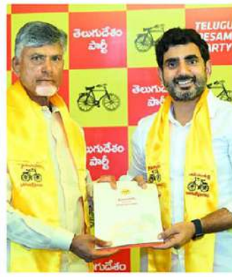
నారా లోకేశ్ (మంగళగిరి)