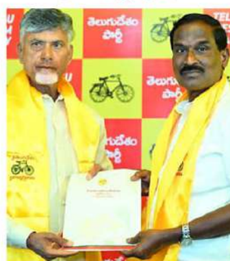
బూర్ల రామాంజనేయులు (పత్తిపాడు)