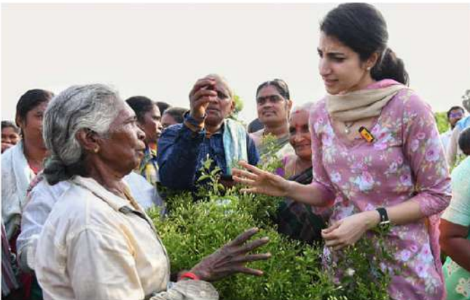
రాష్ట్రాన్ని ద్రవ్య, గంజాయి క్యాబులలోగా మార్చేశారు. ఉక్కుపాదం మోపుతారు. భారీగా పెరిగిన నిత్యావసర వస్తువుల ధరలు, ఇంటి వస్తులు, కరెంటుబిల్లులతో

మంగళగిరి, చైతన్యరథం: సమర్థుడైన పాలకుడు ఉంటేనే ప్రజలకు సుపరిపాలన అందుతుంది. గత అయిదేళ్లుగా రాష్ట్రంలో పాలనసాగిస్తున్నవారు మూడు ముక్కలాటతో ప్రజల బతుకులను చిద్రం చేశారని శ్రీమతి నారా బ్రాహ్మణి పేర్కొన్నారు. ఎన్నికల ప్రచారంలో భాగంగా మంగళగిరి రూరల్ జిల్లాలో మల్లె తోటల్లో పనిచేస్తున్న మహిళా కూలీలను కలవిన బ్రాహ్మణి... వారి సాధకవాదకాలు తెలుసుకున్నారు. ఈ సందర్భంగా బ్రాహ్మణి మాట్లాడుతూ... ఒకప్పుడు రాష్ట్రంలోని నిండిన హైదరాబాద్ ను సైబిక్ సిటీ నిర్మాణం ద్వారా విశ్వనగరంగా మార్చిన దార్శనకుడు చంద్రబాబు నాయుడు. ఎల్లప్పుడూ ప్రజాక్షేమాన్ని కాంక్షించే చంద్రబాబుపై తప్పుడు కేసులు పెట్టి 53 రోజులపాటు అక్రమంగా జైలులో నిర్బంధించారు. కష్టపూరిత రాజకీయాలకు రాబోయే ఎన్నికల్లో ప్రజలే తగిన గణపాతం చెబుతారు. రాష్ట్రంలో మహిళలపై దాడులు పెరగబోయాయి. భద్రతలేక భయంతో బిచ్చు బిచ్చు మంటూ జీవనం సాగిస్తున్నారు. నాసికం మద్యం కారణంగా నిరుపేద కుటుంబాలు నాశన మవుతున్నాయి. ఒకప్పుడు అన్నపూర్ణగా ఉన్న