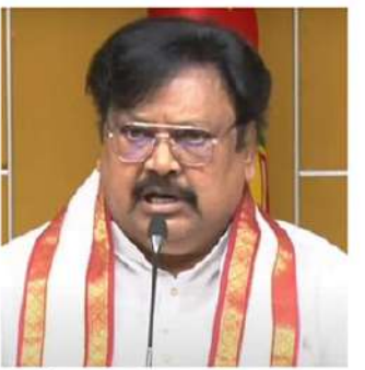
విధుల్లోని ఉద్యోగులకు పోస్టల్ బ్యాంకులో ఓట్లు పేజీలను గ్రేడ్ చేయాలని కోరారు.