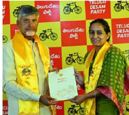
బైరెడ్డి శబల (నంద్యాల)