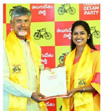
బండారు శ్రావణిశ్రీ (శింగనమల)