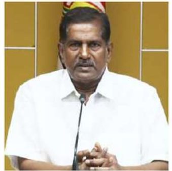
లు తీసుకుని నోడల్ అధికారులను నియమించి నోడల్ ఆఫీసర్ల ఎవరో కింది స్థాయి అధికారులకు తెలిసేలా చర్యలు చేపట్టాలన్నారు. విస్తృతంగా ప్రచారం చేయాలన్నారు. ఫారం 12ను ఉద్యోగుల నుండి తీసుకోవా

నోడల్ ఆఫీసర్లు ఎవరో ఇంకా స్పష్టత లేకుండా ఉందన్నారు. కొన్ని చోట్ల నోడల్ ఆఫీసర్లను ఇంకా నియమించలేదన్నారు. వెంటనే ఇల్లు అధికారులు చర్య