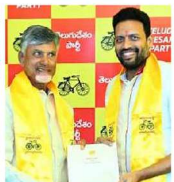
బీజీ భారత్ (కర్నూల్)