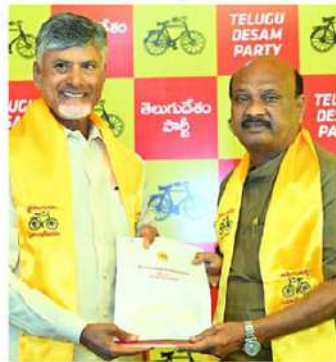
చింతకాయల అయ్యప్పాపాత్రుడు (నర్సపట్నం)