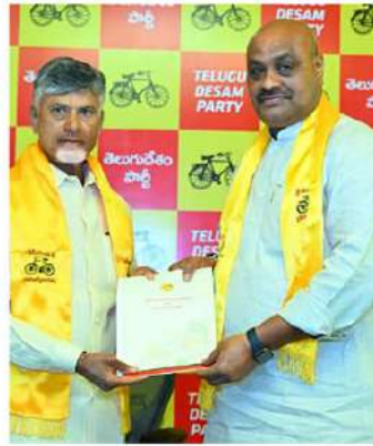
కింజరపు అచ్చెన్నాయుడు (వెక్కలి)