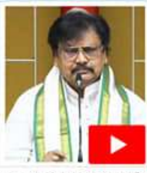
చు బాధ్యు అందుతున్నాడు. అయినా అగ్నిరెట్టి మోక్షం ఓట్టి ముచ్చుమంటా తిచ్చుతున్నాడు. అగ్నిరెట్టి అచ్చునా ఆ ప్లాస్టిక్ గ్రాహుల అంతే వేయి మోతుకుండు పెచ్చురెట్టి చేయాలి. చాలానో తిచ్చు ఉండకీరెట్టి. అగ్ని గుంకరాయి పెచ్చుకు మాక్షం 13 రాబూనా ప్లాస్టిక్ ఉండలేదు. కాదు ఎం వచ్చే అని అవాలి నమచ్చులని అగ్నిరెట్టి అమాయకుం పొంపించి వర్గ అవ్వారు. జగన్ ద్రామాలు అపొరి . రెండు పార్టీల ఎంటిగా గొడ్లి, ములోపారి ఎంటిగా పోటీచేస్తున్న అమాయెట్టి దిచ్చి పెచ్చులు అని అగ్ని అందరిలో దిచ్చుమీచిలో? అమాయ కుండరిలో అచ్చం ఏమిటి? మోక్షాపై గొడ్లి

అమరావతి(వైకేసీవర్తం): ఆదికార వారింతో ఎటోరకంగా ప్రజలను మిట్టపెట్టి, మామ మీ ఓట్లు దండకారంగాకి అగ్నిరెట్టి అంద్రము వడతున్నాడు టీడీపీ పోలీటికాలో సభ్యుడు వర్గ రామయ్య పిచ్చంబరా. అందులో అగ్నిరెట్టి ప్లాస్టిక్ గ్రాహకు తెలకు ప్రజలను మోసు చేయాలని బాధ్యున్నాడు. మంగళగిరిలోని టీడీపీ బాకీకు వారాయంలో అమన్ బుద్ధి వారం మీడియా సమావేశంలో బాధ్యుకు సుంకరాయి గ్రాహులో అగ్నిరెట్టి ఈ నెం 13వ తేదీన దిద్దుచెల్ల తగిలి రెండు వారాలువుతున్నా అగ్నిరెట్టి ప్లాస్టిక్ తిచ్చువలె. బుద్ధిపై మోడంలో ప్లాస్టిక్ అభ్యుచ్చువలె సొదబుంతో ఓట్లు తమ కోరాలని అగ్నిరెట్టి తెలకీ తెలకీ ప్లాస్టిక్ గ్రాహులతో ప్రజలను అమాయకులు చేయాలను కుంట్ల వనూ వచ్చి వచ్చుతో లేదు. దిద్దుచెల్లు అగ్ని రెట్టి బాబులు వేలలో లేలో అని బుద్ధుడు మోక్షం ప్లాస్టిక్ గ్రాహుల అందుతున్నాడు. మామ రాబాయికి తగినావున్న ప్లాస్టిక్ అనా తిచ్చువలె. అని అగ్నిరెట్టి వచ్చి అభ్యుచ్చు