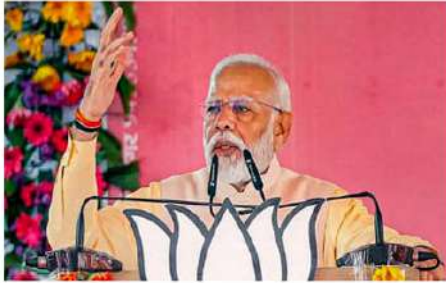
ఆన్ షేర్ అని రాసుకొచ్చారు. దీనిపై ఇటీవల మోదీ మాట్లాడుతూ... "దేశంలో కాంగ్రెస్ నానాటికీ బలహీన పడుతోంది. ఇక్కడ ఆ పార్టీ అస్తిశాస్త్రం కోల్పోతుంది. అక్కడ పాకిస్థాన్ కన్నట్లు పెట్టుకుంటోంది. కాంగ్రెస్ యువరాజును (రాహుల్ ను ఉద్దేశిస్తూ) భారత ప్రధానిని చేయాలని దావాది చేతం తపశపాలనాతోంది. ఆ పార్టీ పాకీకు అభిమాని అని మనకు తెలుసు. ఇప్పుడు వారి మధ్య భాగస్వామ్యం బయటపడింది" అని దుయ్యబట్టారు.

రాంఛీ: కాంగ్రెస్ దేశాన్ని పాలించిన రోజుల్ని ప్రస్తావిస్తూ ప్రధాని మోదీ తీవ్ర విమర్శలు చేశారు. ఉగ్రదాడుల తర్వాత ఏమీ చేయలేక, అంతర్జాతీయ వేదికలపై సహాయం కోసం అర్పించేదని పూట వ్యాఖ్యలు చేశారు. లోక్ సభ ఎన్నికల ప్రచారంలో భాగంగా జార్ఖండ్ లో పర్యటిస్తోన్న ఆయన కాంగ్రెస్, జేఎంఐఎల పై విమర్శలు చేశారు. "గతంలో ఉగ్రదాడుల తర్వాత... కాంగ్రెస్ నేతృత్వంలోని పీఠికీ ప్రభుత్వం అంతర్జాతీయ వేదికలపై పెడబోట్లు పెట్టింది. కానీ ఇప్పుడు ఆ రోజులు పోయాయి. ప్రస్తుతం సహాయం కోసం ఏడుస్తూ కేకలు పెడుతోంది. సర్దికత్ ప్రయత్నం అల్లాడిపోయిన దానిని దేశం... యువరాజు ప్రధాని కావాలని ప్రార్థిస్తోంది" అని ప్రధాని దుయ్యబట్టారు. అయితే బలమైన భారత్... అంతే బలమైన ప్రభుత్వాన్ని కోరుకుంటోందన్నారు. అలాగే జార్ఖండ్ అధికార కూటమి జేఎంఐఎ-కాంగ్రెస్ పై అవినీతి ఆరోపణలు చేశారు. ఆ పార్టీల నేతలు తమ వారసుల కోసం భారీగా సుపదను కూడబెడుతున్నారని ఆరోపణలు చేశారు. "నాకు సొంతంగా ఇల్లు, సైకిల్ కూడా లేదు. ముఖ్యమంత్రిగా, ప్రధానిగా ఉన్న కాలంలో నాపై ఒక్క అవినీతి మచ్చా లేదు" అని అన్నారు. పాక్ మాజీ ప్రధాని ఇమ్రాన్ ఖాన్ తేదీనెలో మంత్రిగా పని చేసిన ఫవ్వద్ హుస్సేన్ ఇటీవల తన సోషల్ మీడియా ఛానెల్ రాహుల్ గురించి ఓ పోస్ట్ పెట్టారు. ఎన్నికల ప్రచారంలో కాంగ్రెస్ నేత ప్రసంగించిన వీడియోను షేర్ చేసి... రాహుల్