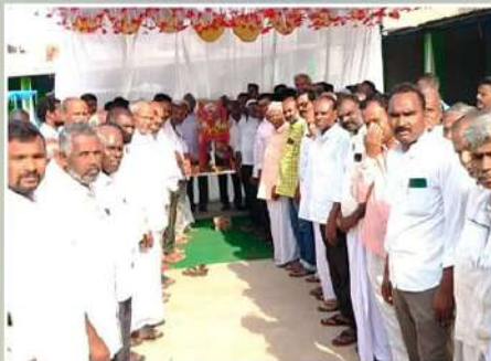
దేవాలపేటలో ఎన్టీఆర్ కు ఘనంగా నివాళులర్పించిన టీడీపీ నేతలు