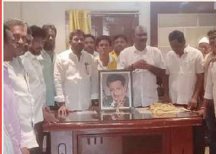
ప్రకాశం జిల్లా గిద్దలూరు నియోజకవర్గంలో ఎన్టీఆర్ కు ఘన నివాళి