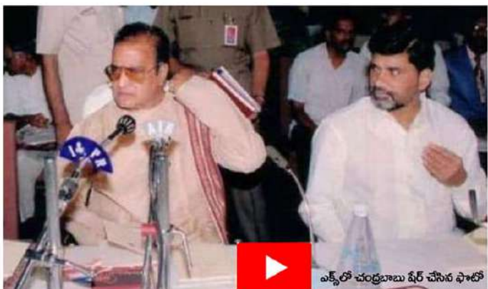
తన రాష్ట్రం కోసం, తెలుగుజాతి వైఖారం కోసం ఎన్టీఆర్ తన జీవితాన్ని అంకితం చేశారు. ఆయన జయంతి సందర్భంగా ప్రజల అరుగు ప్రజల కోసం అనే సంగతులను తీసుకుందామని చంద్రబాబు పిలుపు ఇచ్చారు.

అమరావతి: తెలుగు వెలుగు, తెలుగుజాతికి స్ఫూర్తి, కీర్తి ఎన్టీఆర్ అని టీడీపీ అధినేత చంద్రబాబు కొనియాడాడు. టీడీపీ వ్యవస్థాపకుడు, దివంగత మాజీ ముఖ్యమంత్రి ఎన్టీఆర్ 101వ జయంతి సందర్భంగా మంగళవారం చంద్రబాబు నివాళులర్పించారు. అన్న ఎన్టీఆర్ సేవలను స్మరించుకుందామని పార్టీ శ్రేణులకు ఆయన పిలుపునిచ్చారు. క్రమశిక్షణ, పట్టుద, చిత్తశుద్ధి, ప్రజలకు మంచి చేయాలనే తపనే ఒక సామాన్య రైతు బిడ్డ అయిన తారక రామదేవి మహా నాయకునిగా తీర్చిదిద్దాయి. సమాజం దేవాలయం.. ప్రజలే దేవుళ్లు అని త్రికరణ భక్తిగా వచ్చిన ఎన్టీఆర్. తెలుగుదేశం పార్టీ స్థాపనతో దేశంలోనే మొదటిసారిగా సంక్షేమ పాలనకు శ్రీతారం చుట్టారు. పేదవారికి కూడు, గూడు, గుడ్ల ఇవ్వడమే అధికారానికి అర్థం అని చెప్పి, ఆచరించి చూపారు. సంక్షేమంకో పాటే అభివృద్ధి. పాలనా సంస్కరణలకూ బాటలు వేశారు. ప్రజల పద్ధతుల పాలనకో పాలకుడు అంటే ప్రజలకు సేవకుడు అని ఎన్టీఆర్ చాటి చెప్పారు. ప్రజల అభ్యున్నతే ఏకైక లక్ష్యంగా పని చేసి అన్ని వర్గాలకు అత్యుంధుడు అయ్యారు. పేదరికం