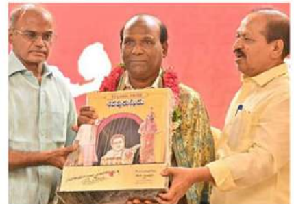
ఎన్టీఆర్ వంట మనిషి వీరయ్యకు సత్కారం