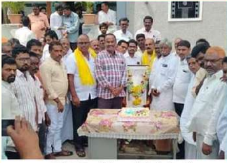
రాయచోటి నియోజకవర్గం గాలివిడు మండలంలో ఘనంగా ఎన్టీఆర్ జయంతి వేడుకలు