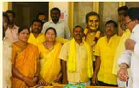
ప్రకాశం జిల్లా డీటీసీ కార్యాలయంలో ఘనంగా ఎన్టీఆర్ అమూలీ వేదకల నిర్వహించిన డీటీసీ వేణు