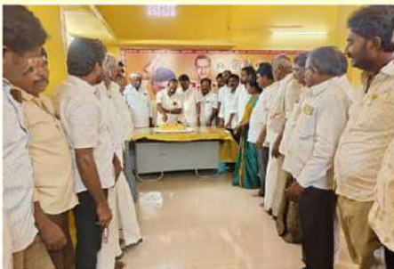
కనిగిరి నియోజకవర్గం, వెలగండ్ల మండలంలో ఎన్టీఆర్ జయంతి సందర్భంగా కేక కట్ చేస్తున్న ధృత్యం