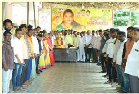
నందిగామ నియోజకవర్గంలో ఎన్టీఆర్ కు నివాళులర్పించిన పట్టణ తెలుగుదేశం పార్టీ నేతలు