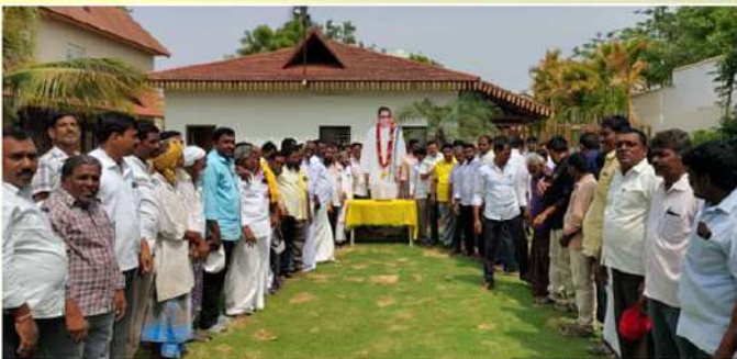
బనగానపల్లె టీడీపీ కార్యాలయంలో టీడీపీ-జనసేన నేతలు పెద్ద ఎత్తున పాల్గొని ఎన్టీఆర్ కు నివాళులర్పించారు