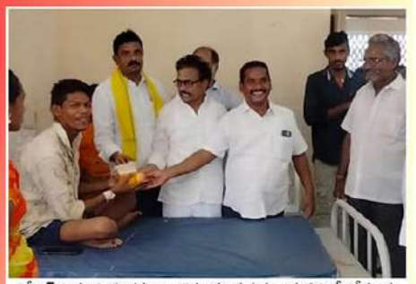
ఎన్టీఆర్ జయంతి సందర్భంగా కొప్పులు ప్రభుత్వ ఆసుపత్రిలో రోగులకు ట్రైల్ పళ్ళు వంపిణీ చేసిన డీడీపీ శ్రేణులు