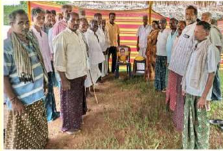
గన్నవరం నియోజకవర్గం, జాపులపాడు మండలం, రంగస్థలగూడెంలో ఎన్టీఆర్ కు నివాళులర్పిస్తున్న టీడీపీ నేతలు