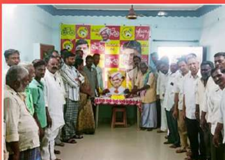
పీఠేరు నియోజకవర్గం వాళ్ళిప్పరంలో ఘనంగా ఎన్టీఆర్ జయంతి వేడుకలు