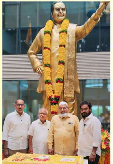
పార్టీ కేంద్ర కార్యాలయంలో జరిగిన జయంతి వేడుకల్లో పాల్గొన్న టీడీపీ నేతలు ఏపీ రమణా కదితరలు