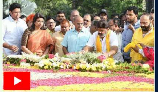
ఎన్టీఆర్ చిరంజీవి ఫీర్ చేసిన ఫొటో

వెలుగొంతుకున్న సమయంలోనే రాజకీయాల్లోకి వచ్చారని తెలిపారు. ఎన్టీఆర్ రాజకీయాల్లోకి వచ్చాక మైక్లు, న్యాయవాదులు, అభిమానులైన ఎందరో సామాన్యులను రాజకీయాల్లో తీసుకొచ్చారని పేర్కొన్నారు. తెలుగు జాతి అత్యగౌరవాన్ని చాటి చెప్పారన్నారు. ఆయన తీసుకొచ్చిన పథకాలనే నేటికీ అందరూ అవలంబిస్తున్నారని ఈ సందర్భంగా బాలకృష్ణ గర్వం చేశారు.