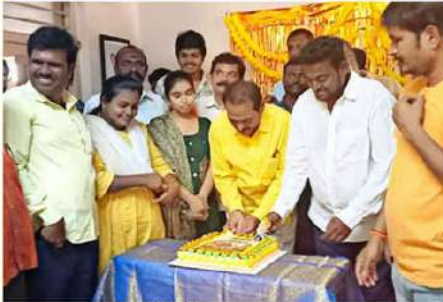
నెల్లూరు జిల్లా టీడీపీ టీసెల్ సెల్ రాష్ట్ర ఉపాధ్యక్షులు భర్తవరం సుబ్బారావు ఆధ్వర్యంలో జయంతి వేడుకలు