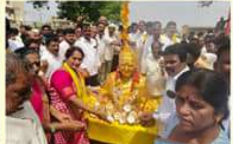
పెనుకొండ సమీపకడల్ల మాజీ ఎమ్మెల్యే అధ్యక్ష ముఖ్యమంత్రి అధ్యక్షులలో ఘనంగా ఎన్టీఆర్ 101 వ అమూలీ వేదకల నిర్వహించిన డీటీసీ కే.ఎం.ఎం. కేసరిపాటి ముఖ్యఅతిథిగా పాల్గొని, తెలుగుదేశం పార్టీ నాయకులు