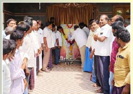
సోమల మండలం కంధూరు పంచాయతీలో ఎన్టీఆర్ కు ఘన నివాళి