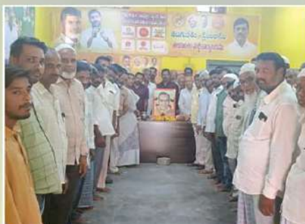
గుర్రంకొండలో ఎన్టీఆర్ చిత్రపటానికి పూలమాల వేసి నివాళి ఘటించిన నేతలు