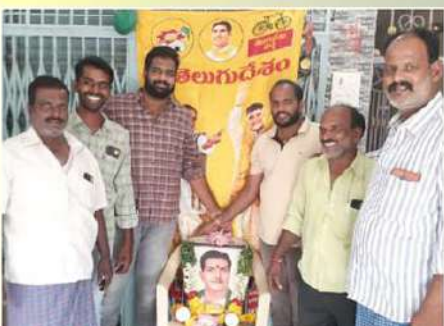
పులివర్తి మండలంలో ఎన్టీఆర్ కి ఘనంగా నివాళులర్పించిన నేతలు