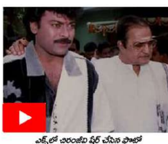
ఎన్టీఆర్ చిరంజీవి ఫీర్ చేసిన ఫొటో