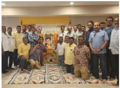
చార్జిట్ లో ఘనంగా ఎన్టీఆర్ జయంతి ఉత్సవాలు

సీసీ, రాజకీయ జీవితంలో ఎన్టీఆర్ కు ఎవరూ సాది లేరని చిత్తూరు జిల్లా పలుమనేరు టీడీపీ నేతలు కొనియాడారు. పట్టణంలోని టీడీపీ కార్యాలయంలో ఎన్టీఆర్ జయంతి వేడుకలు ఘనంగా నిర్వహించారు. తిరుపతి జిల్లా నాయుడుపేట టీడీపీ కార్యాలయంలో ఎన్టీఆర్ జయంతి వేడుకలు ఘనంగా నిర్వహించారు. ఎన్టీఆర్ చిత్ర పటానికి పూలమాలలు వేసి నివాళులర్పించారు. అనంతరం సీనియర్ కార్యకర్తలను సన్మానించారు.