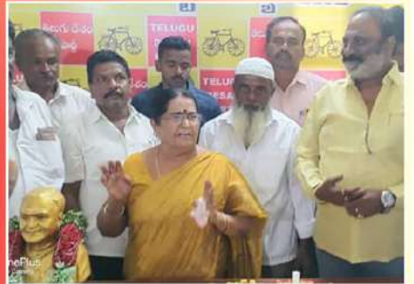
పుంగనూరులో ఎన్టీఆర్ కు ఘన నివాళులర్పించిన పార్టీ శ్రేణులు