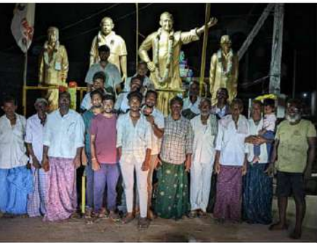
అల్లంకి నియోజకవర్గం, సంతమాగులూరు మండలం, వకేపురం గ్రామంలో