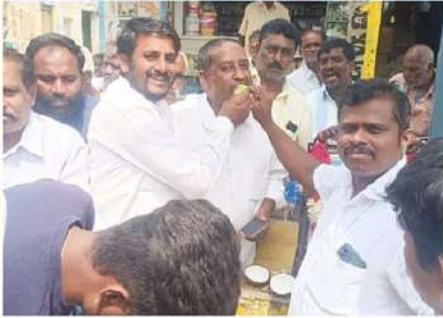
శంబళ్లపల్లిలో ఘనంగా ఎన్టీఆర్ జయంతి వేడుకలు