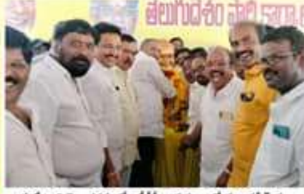
అగ్గంపేట సమీపకడల్ల డీటీసీ అధ్యక్షులు ధోతం ధోతం ముఖ్య అతిథిగా పాల్గొని ఎన్టీఆర్ విగ్రహానికి ఘనంగా వేదకల్లో కేక కలిపి వేదకల నిర్వహించిన డీటీసీ కే.ఎం.ఎం. కేసరిపాటి ముఖ్యఅతిథిగా పాల్గొని, తెలుగుదేశం పార్టీ నాయకులు