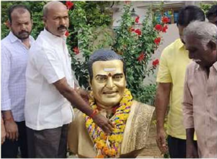
నిడదవోలు నియోజకవర్గం వేలువెమ్మ గ్రామంలో అభిమానుల నివాళి