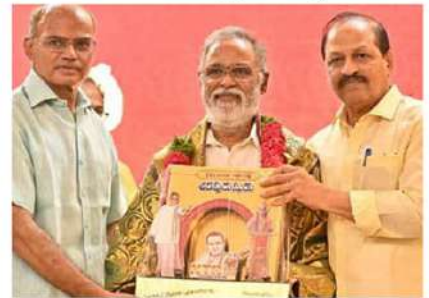
ఎన్టీఆర్ పీఠ శివరామ్ కు సత్కారం