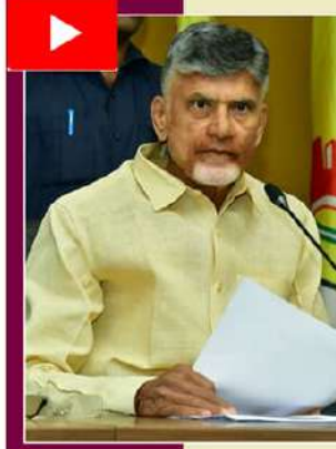
ఉంటుంది. కానీ.. జగన్ ప్రభుత్వ ఉన్నతాధికారుల ఆదేశాల ప్రకారం కమిషనరులతోపాటు అధికారిక ముద్ర వేయకుండా పోస్టల్ బ్యాలెట్లను చెల్లనివిగా (జన్ బాలెట్) చేసే ప్రయత్నం జరిగింది.

ఎన్నికల నియమాల ప్రకారం ఎన్నికల విభాగంలో ఉండి పోస్టల్ బ్యాలెట్లను వినియోగించుకున్న రాష్ట్ర ప్రభుత్వ అధికారులు ఇచ్చిన డిక్లరేషన్లపై ఒక గెజిటెడ్ స్టాంపు అధికారి సంతకం చేయాల్సివుంటుంది. పోస్టల్ బ్యాలెట్లను వెనుక వైపు రిటర్నింగ్ అధికారి సంతకం చేయాలి. కమిషనరులతోపాటు కమిషనరు, పదవీ విరమణ తలపే సీనియర్ అధికారులు