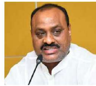
అప్పులను బినామీ కాంట్రాక్టర్లకు, కంపెనీలకు బిల్లుల రూపంలో చెల్లించి అధికార దుర్వినియోగానికి