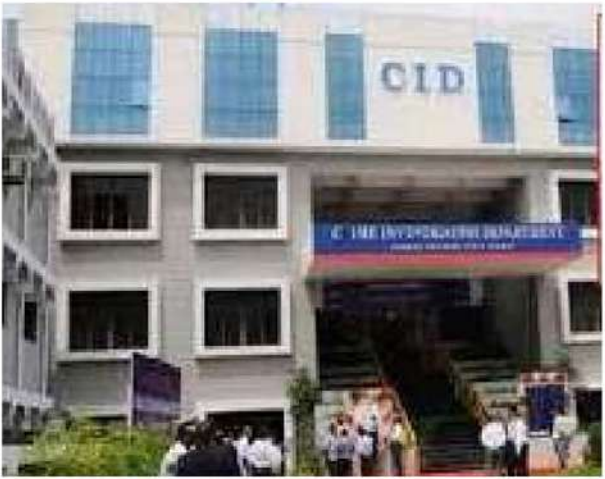
ఆఫీసీను సీజ్ చేయాలని గవర్నర్ ఆదేశాలు జారీ చేశారు. లీఫ్ సెక్రటరీలు, స్పెషల్ లీఫ్ సెక్రటరీలు, ప్రీన్సిపల్ సెక్రటరీలు, సెక్రటరీలు, విభాగాధిపతులు కార్యాలయాల్లో