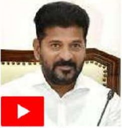
టీడీపీ ఆధిపత్య చంద్రబాబు నాయుడు తనను ప్రమాణ స్వీకారానికి ఆహ్వానిస్తే తప్పకుండా వెళతానని

తెలంగాణ ముఖ్యమంత్రి రేవంత్ రెడ్డి ఆన్వాయం. ఏపీకి ప్రత్యేక హోదా ఇవ్వడానికి కాంగ్రెస్ అగ్రనేత రాహుల్ గాంధీ కట్టుబడి ఉన్నారన్నారు. అయితే ఈ అంశంపై పార్టీలో చర్చించాక చంద్రబాబుతో మాట్లాడరావచ్చన్నారు. ఏపీకి ప్రత్యేక హోదా చట్టబద్ధతతో కూడుకున్న హామీ అని వెల్లడించారు. కానీ కాంగ్రెస్ పార్టీ సూచనల మేరకే సదుచుకుంటానని వ్యాఖ్యానించారు. ఆంధ్ర ప్రదేశ్ లో ఏ ప్రభుత్వం వచ్చినా సామర్యంగా రాష్ట్ర సమస్యలు పరిష్కరించుకుంటామని గతంలోనే చెప్పానని గుర్తుచేశారు.