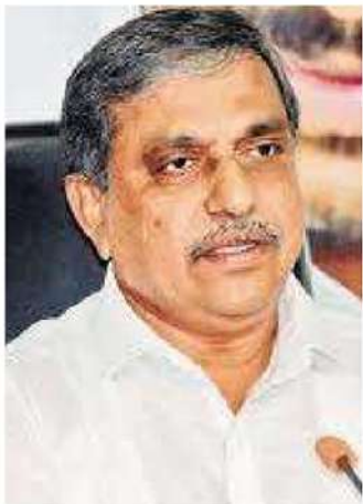
అసెంబ్లీ ఎన్నికల్లో వైసీపీ ఘోరంగా ఓడిపోవడంతో పలువురు ప్రభుత్వ సలహాదారులు తమ పదవులకు రాజీనామాలు చేశారు. జగన్ ప్రభుత్వంలో కీలకంగా