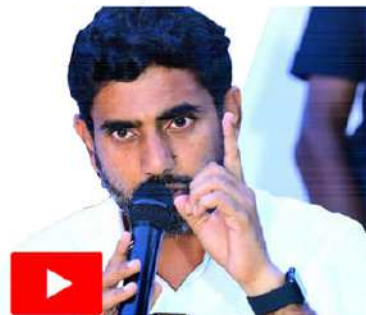
- బివరాలు 6 లో.

ఉలుకులేదు పలుకులేదు యేమైనా... మన జగ్గడం! ఎదురు దెబ్బ తగలగానే మాయమయ్యే మారీచుడు!! దప్పుకోట్ల మంతులంత మిగిలిపోయే... మాజీలుగ కాలమెంత కఠినమాయే నలివేసెను... నిర్ణయంగా!! చెలుతున్నా... విన్నారా జలగభక్త మూడులా! వడ్డారంగ... మిడిసిపాటు తప్పలేదు భంగపాటు!? మాటమితో కుదురుకుంది రాష్ట్రమంత గడనది! వైసీపీ నియంతలకు ప్రజా తీర్పు పెద్ద ఉరి!! -మహావేద