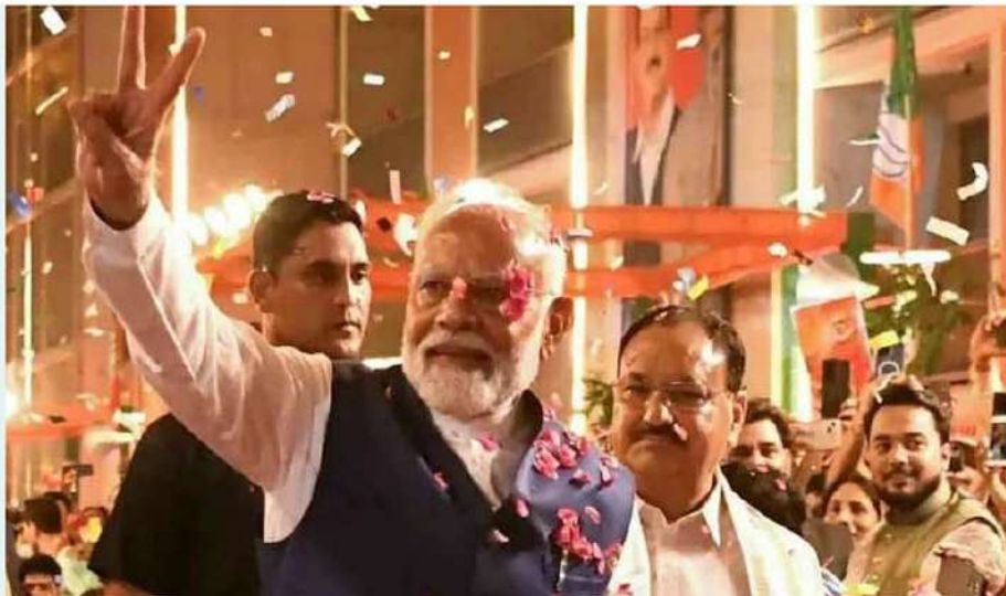
శ్రమస్తా. వారు రెండు అడుగులు చేస్తే... నాలుగు అడుగులతో ముందుకు సాగుతా. అన్ని ప్రాంతాలు, వివిధ వర్గాల ప్రజలు అభివృద్ధికి ఎన్డీయే కూటమి కట్టుబడి ఉంది" అని మోదీ పేర్కొన్నారు.

ప్రపంచంలో భారత్ బలమైన శక్తిగా అవతరిస్తుంది. మనమంతా సుస్థిరంగా కృషి చేస్తే సరికొత్త అభివృద్ధి లభిస్తుంది. అదే ప్రజలకు మోదీ హామీ" అని ప్రధాని అన్నారు. అందుకు కూటమి కట్టుబడి ఉంది. "కొందరు 10 గంటలు పనిచేస్తే... నేను చేశాం కోసం 18 గంటలు