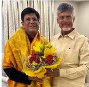
ధిల్లీలో ఐదవారం కేంద్రమంత్రి వీయాన్ గోడులోతో ఖేదీ అయిన టీడీపీ అధినేత నారా చంద్రబాబునాయుడు.

పేషీలు స్వాధీనం నవివాలయంలోని మంత్రుల ఛాంబర్లను సాధారణ పరిపాలన విభాగం (జిపిడీ) స్వాధీనం చేసుకుంటోంది. మంత్రులు, సలహాదారుల పేషీల నుండి నేమ్ లోర్డులను జిపిడీ సిబ్బంది తొలగించారు. మంత్రుల పేషీల్లోని కంప్యూటర్లు, ఫర్నిచర్ వివాలయ నుండి తేసుకుని, తమ వద్ద ఉన్న జాబితాలోని లెక్కల వివరాలతో సరిపోల్చుతుంటున్నారు. వ్యక్తిగత సామగ్రి కరెంటుచే సమయం లో విల్లులు తనిఖీ చేస్తున్నారు.