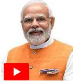
ప్రభుత్వ ఏర్పాటుకు ఆహ్వానించాలని కోరుతూ ఎన్టీయే కొత్త ఎంపీలతో కలిసి మోదీ.. రాష్ట్రపతిని కలవవచ్చన్నారు.