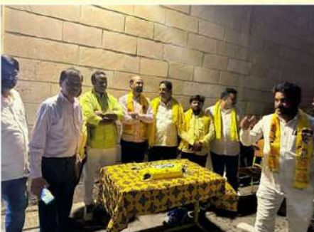
అంబరానందీని ప్రవాసాంధ్రుల విజయోత్సవ సంబరాలు