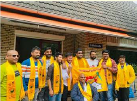
జర్నీలోని హాబర్గ్లో దీక్షిపీ శ్రేణుల ఆనందోత్సవాలు