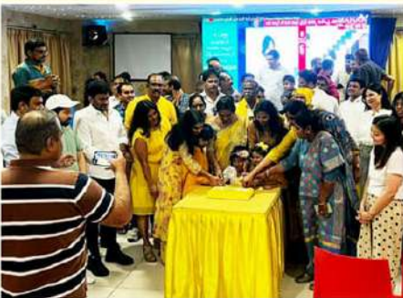
యాపకలో అంబర్నా అంబేలా సంబరాలు చేపట్టిన ఎన్ఆర్ఐలు