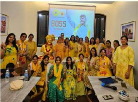
సింగపూర్లో సంబరాలు చేపట్టిన ఎన్ఆర్ఐ మహిళలు