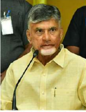
ఆదేశించారు. వీటిని సెక్యూరిటీ పేరుతో కాన్యామ్ వెళ్లే దారిలో గంబుల తరబడి వాహనాలు నిలిపేసే విధానాలకు స్పష్ట

వాహనాలు నియంత్రిస్తే చాలు అమరావతి(చైతన్యరథం): భద్రత పేరుతో సామాన్య ప్రజలను ఇబ్బంది పెట్టొద్దని అధికారులకు లకు డీ.పీ. అధినేత చంద్రబాబు సూచించారు. చంద్రబాబు గురువారం రాత్రి ఢిల్లీ వెళ్లేందుకు ఉండవల్లి నుంచి గున్మవరం విమానాశ్రయానికి బయలుదేరగా, కాన్యామ్ వెళ్తున్న క్రమంలో సాధారణ ప్రజల వాహనాలను పోలీసులు నిలిపి వేశారు. దీనిని గమనించిన చంద్రబాబు... భద్రతా సిబ్బందికి కొన్ని సూచనలు చేశారు కరకట్టపై, కాన్యామ్ వెళ్తున్న ప్రాంతంలో ఎప్పుడు సమయం ట్రాఫిక్ ఆపొద్దని భద్రతా సిబ్బందిని