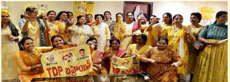
బహాయిన్లో విజయోత్సవ సంబరాలలో దీక్షిపీ మహిళలు