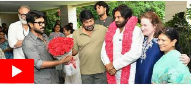
సాగవాయి భార్యద్వారానికీ గురయ్యారు. ఆ సమయంలో అక్ష్మమన్న వారంతా ఒకేతర భార్యద్వారానితో కూడిన ఆనందంతో నిండిపోయారు. 'దియర్ కల్యాణ్ బాబు' అంటూ రేకెను కట్టే చేశారు. పవన్ కల్యాణ్ ఈ తర్వాత తన తల్లి, వదిన పాదాలకు కూడా సమస్థించారు.