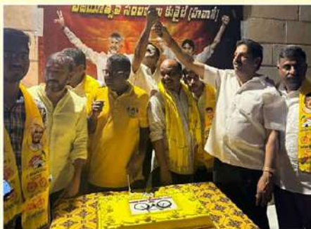
అంబరానందీని ప్రవాసాంధ్రుల విజయోత్సవ సంబరాలు