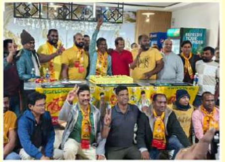
కువైట్లో కేక్ కట్ చేస్తూ సంబరాలు చేస్తున్న ఎన్ఆర్ఐలు