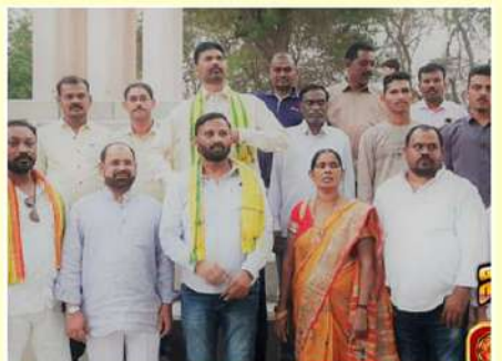
కువైట్లో దీక్షిపీ శ్రేణుల సంబరాలు