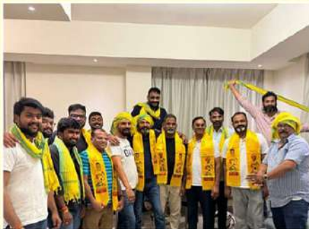
జాంబయాలో సంబరాలు చేస్తున్న ఎన్ఆర్ఐలు