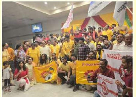
అమెరికాలోని డెట్రాయిడ్ లో దీక్షిపీ శ్రేణుల సంబరాలు