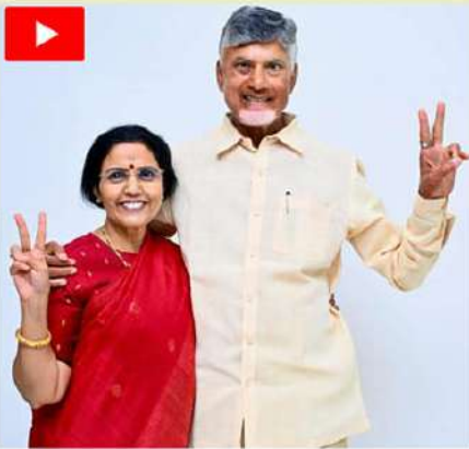
మళ్ళీ చిగురిస్తున్నాయి. ఇది నా మనసుకు ఎంతో సంతోషాన్నిచ్చింది. ఇక ప్రజలకు అంకా మంది

అమరావతి(చైతన్యరథం): అద్భుతమైన ప్రజాతీర్పుతో రాష్ట్రంలో ప్రజాపాలన మొదలైంది ముఖ్యమంత్రి నారా చంద్రబాబు నాయుడు సతీమణి భువనేశ్వరి అన్నారు. చంద్రబాబు నాయకత్వంలో రాష్ట్రానికి ఇక అన్నీ మంచిరోజులని ఎక్కడో భువనేశ్వరి పేర్కొన్నారు. నాడు నిజం గెలవాలి కార్యక్రమంలో ప్రజల ఆవేదన చూశాను... బాధలు విన్నాను... అమ్మలను తెలుసుకున్నాను. అణచివేతను అర్థం చేసుకున్నాను. నేను కోరుకున్నట్లుగానే అద్భుతమైన ప్రజాతీర్పుతో ప్రజా పాలన మొదలైంది. ఈ రోజు రాష్ట్రంలో ఎక్కడ చూసినా ప్రజలు తామే