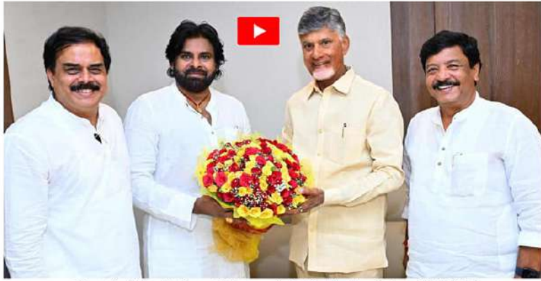
నవీనాలయంలో ముఖ్యమంత్రి నాదా చంద్రబాబు నాయుడుని మంగళవారం అయిత భాంబరీకి వెళ్లి కలిసిన ఉప ముఖ్యమంత్రి వినోద్ కళ్యాణ్, మంత్రులు నాచేపల్లి మణిశంకర్, కందుల దుర్గేశ్

21, 22 తేదీల్లో అసెంబ్లీ సమావేశాలు అమరావతి: ఏపీ అసెంబ్లీ సమావేశాల తేదీల్లో మార్పు జరిగింది. ఈ నెల 24 నుంచి జరుగుతాయని తొలుత పేర్కొన్నారు. ఇప్పుడా తేదీలో మార్పు చేశారు. ఈ నెల 21 నుంచే అసెంబ్లీ సమావేశాలు నిర్వహించాలని కూటమి ప్రభుత్వం నిర్ణయించింది. ఈ నెల 21, 22 తేదీల్లో అసెంబ్లీ సమావేశాలు నిర్వహించనున్నారు. ప్రాటెం స్పీకర్ గా గౌరంధ్ర బుచ్చయ్య చౌదరి వ్యవహరిస్తారని తెలుస్తోంది. రెండ్రోజుల పాటు జరిగే అసెంబ్లీ సమావేశాల్లో ఎమ్మెల్యేల ప్రమాణ స్వీకారం, స్పీకర్, డిప్యూటీ స్పీకర్ పనిని నిర్వహించనున్నారు.