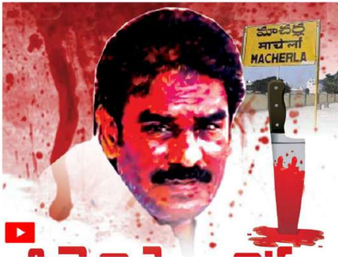
ఎకరాల్లో కంకర తవ్వి అమ్ముతుని రూ.40 కోట్లు వెనకేశారు.