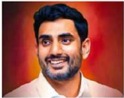
విద్యార్థిని, విద్యార్థులకు మంత్రి లోకేష్ శుభాకాంక్షలు తెలిపారు.

ఆమరావతి: ఇంటర్మీడియట్ ప్రథమ సంవత్సరం సస్టిమెంటులో పరీక్ష ఫలితాలను రాష్ట్ర విద్య, ఇ.డి, ఎలెక్ట్రానిక్స్ శాఖల మంత్రి నారా లోకేష్ బుధవారం సాయంత్రం సచివాలయంలో విడుదల చేశారు. https://resultsbie.ap.gov.in వెబ్ సైట్ ద్వారా విద్యార్థులు తమ ఫలితాలను తెలుసుకోవచ్చు. సస్టిమెంటులో మెరుగైన ఫలితాలు సాధించిన