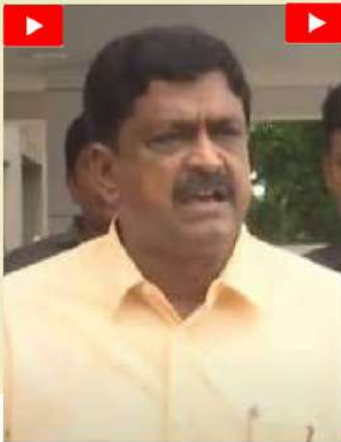
మునిగిపోతారు. మధ్యం, జనుక భాతాల పుస్తకాలే కాదు... శాసనసభ పార్లమెంటులో నిబంధనలు ఉండే కొద్దీ అందే షర్తు వున్నకం, అసెంబ్లీ రూల్ బుక్ చదవాలి. ఓవనూలు కూడా చూసుకోకుండా మీతో ఈ

లేఖ రాయించారు. 10శాతం సభ్యులు కూడా లేకుండా ప్రతిపక్ష హెబాదా ఎలా సన్నం దని పయ్యపుల ప్రశ్నించారు.