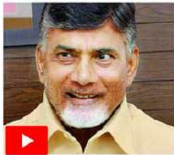
సాధించాలని కోరుకుంటున్నానని చంద్రబాబు ట్వీట్ చేశారు.

ఆమరావతి: వరుసగా రెండోసారి లోక్ సభ స్పీకర్ గా ఎన్ డీపీ ఆభర్త్య ఓం బిర్లా ఎన్నికైన విషయం తెలిసిందే. ఈ సందర్భంగా ఆయనకు ఏపీ ముఖ్యమంత్రి చంద్రబాబు నాయుడు 'ఎక్స్' (టీవీట్) వేదికగా శుభాకాంక్షలు తెలిపారు. 18వ లోక్ సభ స్పీకర్ గా ఎన్నికైన ఓం బిర్లాకు ఆభినందనలు... మన పార్లమెంటులో సంప్రదాయాలను నిలబెట్టి, చిత్తశుద్ధి, విజ్ఞతతో సభను నడిపించడంలో ఆయన విజయం