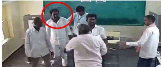
పిన్నెల్లి నేర వారసత్వం - వెల్లెల్లి మండలం కల్లకుంక గ్రామానికి చెందిన