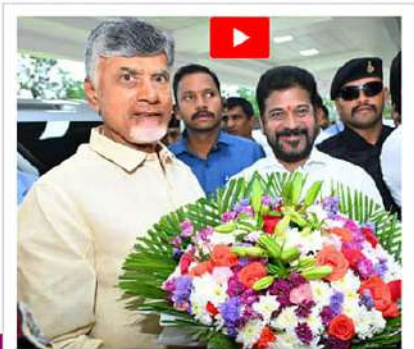
- వివరాలు 2 లో..

పారదర్శకత గురించి మీరు మాట్లాడటమూ... బొత్తు భలే జోకులేస్తున్నారని అచ్చెన్నాయుడు చురకలు 3