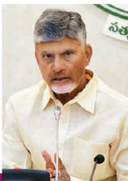
- వివరాలు 2 లో..