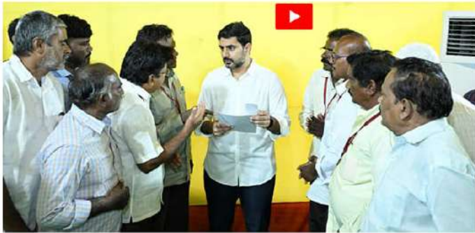
శుక్రవారం నారా లోకేశ్ ప్రజాధర్షణ కు వినతులు వెల్లువెత్తాయి.

ఆమరావతి (త్రైకవేణి): సమస్యల పరిష్కార వేదిక ప్రజాధర్షణకు వస్తున్న విన్నపాలపై వారం వారం సమీక్షించుకున్నట్లు విద్య, ఐ.టి, ఎలక్ట్రానిక్స్ శాఖల మంత్రి నారా లోకేశ్ తెలిపారు. ఉండవల్లి నివాసంలో నిర్వహిస్తున్న ప్రజాధర్షణ కార్యక్రమానికి మంగళగిరిలో పాటు రాష్ట్రవ్యాప్తంగా ప్రజలు పెద్దపెత్తన తరలివస్తున్నారు. తాము పడుతున్న కష్టాలు, సమస్యలపై యువనేతను నేరుగా కలిసి అర్జీలు ఇస్తున్నారు. ఆయా విన్నపాలను శాఖల వారీగా విభజించి సమస్యల పరిష్కారానికి కృషిచేస్తున్నారు. ప్రజల అర్జీలు ఎంతమేరకు పరిష్కారం అయ్యాయి, వాటి స్టేటస్ను ఎప్పటికప్పుడు తెలియజేయాలని అధికారులు, సిబ్బందికి ఈ సందర్భంగా మంత్రి ఆదేశాలు జారీ చేశారు. ఆయా విన్నపాలపై ప్రతివారం సమీక్షించి పరిష్కారానికి చర్యలు తీసుకోనున్నట్లు యువనేత వెల్లడించారు. జోరువానలోనూ 19వ రోజు