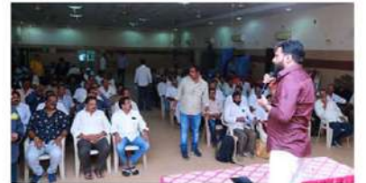
లాలకు సంబంధించిన రెవెన్యూ అధికారులు , నాయకులు తదితరులు పాల్గొన్నారు.