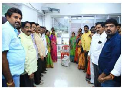
వాడుకున్నారని విమర్శించారు. గతంలో అక్షయపాత్ర ఫౌండేషన్ రుచికరమైన భోజనం అందించిన గుర్తు లేకుండా, గతంలో మాదిరిగా ఆదే 5 రూపాయలకు మంది భోజనం, దీపిష్ట అందిస్తామని స్పష్టం చేశారు. వేద ప్రజలకు కడుపునిండా భోజనం అందించాలన్నది ముఖ్యమంత్రి చంద్రబాబు నాయుడు ఆశీర్వాదమన్నారు. ఈ కార్యక్రమంలో స్థానిక పట్టణ పార్టీ నేతలు పాల్గొన్నారు.

సందిగామ (చైతన్యరథం): రాష్ట్రంలో అన్న క్యాంటీన్లను ఆగస్టు 15 తేదీన ప్రారంభిస్తున్న సందిగామ ఎమ్మెల్యే తంగిరాల సౌమ్య వెల్లడించారు. 2.25 లక్షల మంది అన్నార్థుల ఆకలి తీర్చేలా వీటిని మొదలు పెడుతున్నామన్నారు. మొత్తం 203 క్యాంటీన్లను ప్రారంభించేందుకు కూటమి ప్రభుత్వం సన్నాహాలు చేస్తుందని తెలిపారు. శనివారం ఉదయం సందిగామ పట్టణంలోని స్థానిక రైతు బజార్ వద్ద గతంలో నిర్మించిన అన్న క్యాంటీన్ భవనాన్ని పరిశీలించి దాని నిర్మాణానికి కేటాయించిన కొమ్మరి లక్షల రూపాయల నిధులకు సుపరీ కార్యక్రమానికి శ్రీకారం చుట్టారు. పట్టణ పార్టీ నేతలతో కలిసి కొద్దికాలాకొద్ది పనులు ప్రారంభించారు. ఈ సందర్భంగా తంగిరాల సౌమ్య మాట్లాడుతూ, గత వైసీపీ హయాంలో ఈ క్యాంటీన్ అన్నింటినీ గోదామలు, సదీవాలయాలగా, ప్లీటింగ్ నిల్వ కేంద్రాలుగా