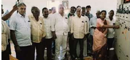
పనులను చంద్రబాబు నాయుడుకి అలోచనలో ఉన్నట్లు తెలియజేశారు. 1వ తేదీన ఉదయం 5-30 గంటలకు గ్రామస్థాయిలో కూటమి నేతలు, అధికార సిబ్బంది త్రేత స్థాయిలో అందబాటులో ఉండి 6 గంటలకే పెన్షన్ మెల్లార్ని లబ్ధిదారులకు పంపిణీ చేయాలన్నారు. అంతకుముందు బొద్దిట్టిపాడు చెరువు కాలువ పూడిక తీసి పనులను కొబ్బరికాయ కొట్టి ప్రారంభించారు. ఈ కార్యక్రమంలో గ్రామ మండల ఎమ్మెల్యే నేతలు, పెద్ద ఎత్తున రైతులు పాల్గొన్నారు.