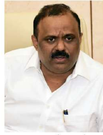
మోసపూరితమైన ఆధారాలతో కొన్ని రిజిస్ట్రేషన్లు జరిగినట్లు గుర్తించామన్నారు. గతంలో ఈ విధంగా జరిగిన మోసపూరిత రిజిస్ట్రేషన్లపై పూర్తి స్థాయిలో అధ్యయనం, విచారణ జరిపి నిజమైన లబ్ధిదారులకు ఎటువంటి అన్యాయం జరుగకుండా, వారికి న్యాయం

గత ప్రభుత్వ హయాంలో అన్న భూముల విషయంలో ఎన్నో అవకాశాలు, మోసపూరితమైన రిజిస్ట్రేషన్లు జరిగినట్లుగా ప్రభుత్వం దృష్టికి వస్తున్నాయన్నారు. ఏసీ వెర్ రిజిస్ట్రేషన్ల ఆధారంగా