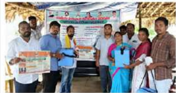
బ్రూసిల్లోసిన వ్యాధి నివారణ

విజయవాడ (చైతన్యరథం): అధికారాన్ని అడ్డుపెట్టుకొని గత ఇదేళ్లలో అనేక అక్రమాలు, అరాచకాలకు పెద్దరెడ్డి రామమోహన్ ప్రాంతాల్లో పాల్పడ్డారని, ఇప్పుడు ఆ పాపాలు రోజురోజుకూ బయటపడుతున్నాయని మాజీమంత్రి దేవినేని ఉమామహేశ్వరరావు ఆగ్రహం వ్యక్తం చేశారు. పెద్దరెడ్డి వాగోన్నాని విగృహాలను, ఆయన కుటుంబం అక్రమంపై విచారణకు ప్రత్యేక కమిటీని ఏర్పాటు చేయాలని దేవినేని ఉమా దిమాండ్ చేశారు. ఈ మేరకు మంగళవారం ఎక్స్ ప్రెస్ దేశికా దేవినేని ఉమామహేశ్వరరావు స్పందించారు. 'మట్టి బతుకే భూములు, అడవులు సరికివేక ఇలా ప్రతిపాటీ పెద్దరెడ్డి దోపిడికి పాల్పడ్డారని, దోచుకోవడమే లక్ష్యంగా పనిచేశారు. మైనింగ్ పై గుర్తింపులేక ఆయననే గౌరవం గుంజుకున్నారు.. మట్టి, ఇసుకను అదే పనిగా కోడేసిన ఘనం. అడవులు సరికినే ప్రకృతి సంపద కొల్లొట్టడంలో ముహూర్తం. విద్యుత్ ప్రాజెక్టులన్ని ఆయన గుప్పెట్లోనే. వేల ఎకరాల ప్రభుత్వ ప్రైవేటు భూములను కబ్బాచేశారు. మద్దు తయారు చేసేది.. దాన్ని ఏపీఎస్ టీడీపీలో తో కొనిపించేది ఈయన కుమార రత్నమే. సాక్షాత్తులు కాల్చేస్తే అక్రమాలు బూడిద అవుతాయా? అగస్త్యోహారెడ్డి కనుసన్నల్లో జరిగిన అంతచేసి అవినీతి సాములపై నారా చంద్రబాబునాయుడి ప్రభుత్వం విచారణ చేస్తుంది. తీరని ధన దాహంతో దోచిన సామ్రాజ్య రాష్ట్ర ఖజానాకు రప్పిస్తాం.' అని దేవినేని ఉమామహేశ్వరరావు ట్వీట్ చేశారు.