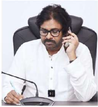
ఆరుగురును... సార్వోత్ అయిల్ను ఒక అంశంను సుంది మరొక అంశంనుకు పంపి చేసి ప్రమంలో లైట్

సంబంధిత శాఖలు సమన్వయంతో సీఫీ ఆడిట్ చేపట్టాలని సూచన