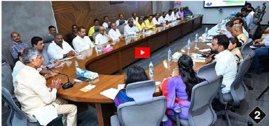
అచ్చుతాపూరం ఫార్మా కంపెనీ ప్రమాదంపై బిజ్నెస్ లిద్దా అధికారులు, మంత్రులు, స్థానిక ప్రజాప్రతినిధులతో సమీక్షిస్తున్న సీఎం చంద్రబాబు