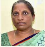
అడుకున్న ప్రభుత్వానికి ధన్యవాదాలు

బ్యాంకు ఖాతాలో ప్రభుత్వం జమ చేసింది. దీంతో పెద్ద దిక్కును కోల్పోయి ఏంచేయాలో తెలియని పరిస్థితిలో ఉన్న ఎంకేయంబాలు ఆనందం వ్యక్తం చేస్తున్నాయి. ఆదుకున్న ప్రభుత్వానికి కృతజ్ఞతలు చెబుతున్నారు.