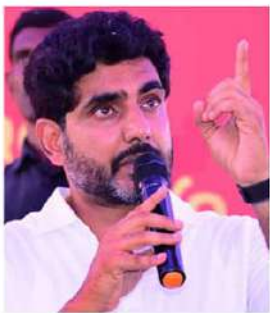
కర్ణాటకాని మంత్రి లోకేశ్ సూచించారు.