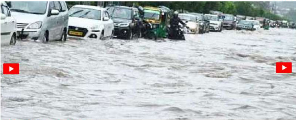
ఇంతతీవ్రమైన వర్షం వరదలను కలపడం వలన...

అమరావతి (చైతన్య రథం) ఎడతెరిపిలేని వాన విజయవాడ, గుంటూరు ప్రాంతాలను అతలాకుతలం చేసింది. వర్షంతో పలుచోట్ల రహదారులు చెరువులను తలపిస్తున్నాయి. విజయవాడలోని విద్యార్థరపురం, ఆర్.ఆర్. నగర్లో రహదారులు జలమయం కావడంతో వాహనదారులు తీవ్ర ఇబ్బందులు పడుతున్నారు. పలుచోట్ల రహదారులపై మోకాళ్ల లోతు నీరు చేరింది. విజయవాడ ఇస్టాండ్ పరిసరాలు నీట మునిగాయి. వాహనదారులు, స్టానికలకు ఇబ్బందులు తప్పలేదు. రామవరప్పాడు రింగ్ రోడ్డునుంచి నిడమానూరు వరకు ట్రాఫిక్ స్తంభిల్చి వాహనాలు నిలిచిపోయాయి. భారీ వర్షాలకు మొగ్గల్రాజపురం సున్నపల్లి సెంటర్ వద్ద కొండ చరియలు విరిగిపడ్డాయి. ఘటనలో నలుగురు దుర్మరణం పాలయ్యారు. పలువురు తీవ్రంగా గాయ పడ్డారు. బెంకే నర్సిర్ ఫైట్ వర్ కింద భారీగా వర్షపు నీరు చేరింది. దీంతో జాతీయ రహదారిపై వాహన రాక పోకలకు ఇబ్బంది తలెత్తింది. విజయవాడలోని దుర్గ గుడి పై ఓవరును తాళాల్సిగా మునివేశారు. ట్రిడ్డి దగ్గర వర్షపు నీరు నిలవడంతో.. మూడు బస్సులు, ఒక లారీ అందులో చిక్కుకున్నాయి. భారీవర్షాలకు గుంటూరు నగరంలో గడ్డిపాడు చెరువు పొంగిపోతుంది. సమీపంలోని ఇళ్లలోకి నీరు చేరడంతో.. స్టానికలు తీవ్ర ఇబ్బందులు పడుతున్నాయి. మంగళగిరి లోల్ షాజా అద్దమత్తం రహదారిపై రాకపోకలకు తీవ్ర అంతరాయం ఏర్పడింది. వర్షపు నీటితో ఆ ప్రాంతం జలాశయాన్ని తలపించింది. దీంతో గుంటూరు-విజయవాడ ప్రయాణికులు తీవ్ర ఇబ్బందులు పడ్డారు. ప్రజలు అద్దమత్తం గుంటూరు, ప్రయాణాలు ఆపేకో వాలని అధికారులు సూచించారు. భారీ వర్షం కారణంగా గుంటూరు ఆటోనగర్, పెద్దకాకాని పోలీస్ స్టేషన్ వరసర ప్రాంతాలు జలమయమయ్యాయి. పెద్దకాకాని మండలం సంపాదం చెరువు పొంగడంతో గ్రామంలోని ఇళ్లలోకి నీరు చేరింది. వీధులు జలమయమయ్యాయి.