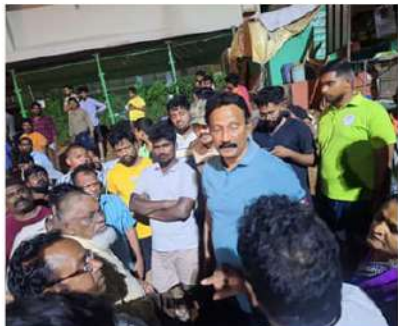
విజయవాడ (వైకెస్సర్): ఎగువన కురుస్తున్న వర్షాల కారణంగా కృష్ణానదికి పొడితనం వరద నీటి ప్రవాహంతో కృష్ణలంక కరకట్ట వెంబడి ప్రాంతాలు ముంపుకు గురయ్యాయని ముంపు కారణంగా ఇబ్బంది పడుతున్న వరద బాధితులకు పార్టీ శ్రేణులు అండగా ఉండాలని శాసనసభ్యులు గద్దె రామ్మోహన్

పిలుపునిచ్చారు. సోమవారం ఉదయం తెల్లవారు జామున 4 గంటల నుంచి రామలింగేశ్వరగర్, కళానగర్, భూపేష్ గుప్తానగర్, రాజాగిరితోట, కాలకరామానగర్, కృష్ణలంక వరద ముంపు ప్రాంతాల్లో ఎమ్మెల్యే గద్దె రామ్మోహన్ వర్షానికి వరద బాధితులను పరామర్శించారు. వరద తీవ్రత పెరుగుతున్నందున ప్రజలంతా కూడా సురక్షిత ప్రాంతాలకు చేరుకోవాలని, పునరావాస కేంద్రాలకు చేరుకునే ఎటువంటి ఇబ్బందులు తలెత్తవని ప్రతి వీధి వీధికి వెళ్ళి ప్రజలను అప్రమత్తం చేశారు. అలాగే పార్టీ శ్రేణులు, స్వచ్ఛంద సంస్థల వారు, యువకులు ఇది ఒక యుద్ధంగా భావించి వరద బాధితులకు సేవచేయడంలో, వారిని సురక్షిత ప్రాంతాలకు చేరవేయడంలో, అక్కరకట్ట ఇస్తూ వరదను కట్టడి చేసే కార్యక్రమాల్లో విరివిగా పాల్గొని బాధితులకు అండగా నిలవాలన్నారు. అర్ధరాత్రి అపరాధి అని తేడాలేకుండా ముఖ్యమంత్రి చంద్రబాబు నాయుడు వరద ప్రాంతాల్లో పర్యటించి అధికారులను పరుగుపెట్టించి ప్రజలకు పాలు, ఆహారం అందిస్తున్నారన్నారు. ఏ ముఖ్యమంత్రి కూడా చేయని విధంగా చంద్రబాబు నాయుడు ప్రజల మధ్య ఉంటూ వారికి మనోధైర్యాన్ని కల్పిస్తున్నారని, నాయకులు అంటే ఎలా ఉందాలో అనేది నేర్పకునేలా 74 సంవత్సరాల వయస్సులో కూడా ఎక్కడా రాజీవడకుండా విశ్రాంతి లేకుండా చంద్రబాబు పనిచేస్తున్నారన్నారు. తూర్పు వియోజకవర్గంలో గద్దె శ్రాంతి నేతృత్వంలో కొందరు యువకులు ఒక టీవీగా ఏర్పడి రేయింఛవల్ల వరద బాధితులకు సేవలందిస్తున్నారన్నారు.