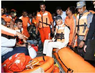
వరద ప్రాంతాల ప్రజలకు అందగా సీఎం

గత శనివారం నుంచి వాయుగుండం ప్రభావం వల్ల కురిసిన అతి భారీవర్షాలతో విజయవాడ నీటి మునిగింది. రాష్ట్ర పరిశ్రమలో 121 సంవత్సరాలు తరువాత ఇంతటి భారీ స్థాయిలో వరదలు రావడం ఇదే తొలిసారి. కృష్ణా నదికి 1903లో 11.90 లక్షల క్యూసెక్కుల వరద ప్రమాదం వచ్చింది. తరువాత 2009లో 11.10 లక్షల క్యూసెక్కుల వరద వచ్చింది. ప్రస్తుతం 11.50 లక్షల క్యూసెక్కుల వరద ప్రమాదం వచ్చిందని అంచనా వేశారు. ఇంతటి విపత్తులో కూడా ముఖ్యమంత్రి నారా చంద్రబాబు నాయుడు ముంపు ప్రాంతాలను పర్యవేక్షించి వరద బాధితులకు భరోసా కల్పించారు. తెల్లవారుజాము నాలుగు గంటల వరకు వరద ప్రాంతాల్లో పర్యవేక్షించారు. ఆ సమయంలో పడవలో తిరుగుతూ బాధితులకు ఆహారం అందజేశారు. తరువాత కేటాలి రెండు గంటలు మాత్రమే విశ్రాంతి తీసుకొని వెంటనే ఉదయం ఆరు గంటలకల్లా అధికారులతో సమీక్షలు నిర్వహించి ప్రభుత్వ యంత్రాంగాన్ని పరుగులు పెట్టిన వరద ప్రాంత బాధితులను సురక్షిత ప్రాంతాలకు తరలించటంలో సీఎం చంద్రబాబు తన మార్కు చూపించారు.