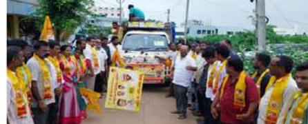
రోజులుగా కండి మీద కుసుకు లేకుండా పనిచేస్తున్నారని అన్నారు. అర్ధరాత్రి వైకెస్సర్ బాధితులను అడుగుంటున్న సేవలను హామీలైన చొరవ మర్చిపోలేదన్నారు. చవవి అంటే అధికారం కాదు... భాధిత అవి భావించే నాయకుడు చంద్రబాబు అని కొనియాడారు. 1996లో కోనసీమ తుఫాన్ సంఘటించినప్పుడు రాజమండ్రి కేంద్రంగా చంద్రబాబు సమీక్షించి పనులు