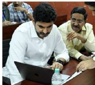
చేశారు. ఐవిఆర్ఎస్ ద్వారా వరదబాధిత ప్రాంతాల ప్రజలనుంచి సహాయచర్యలను వాకలు చేస్తున్నారు.

వరదముంపునకు గురైన సింగ్ నగర్, జక్కంపూడి, కంట్రీగ, దావా కొట్ల సెంటర్, బానా సెంటర్ ప్రాంతాల్లోని అపార్ట్ మెంట్ల పై అంతస్తుల్లో నివసిస్తున్న వారికి డ్రోన్ల ద్వారా ఆహార పొట్లను పంపిణీ చేశారు. టోల్ ఫ్రీ సెంటర్లు 112, 1070లకు వస్తున్న విస్తృతమైన ఎప్పటికప్పుడు స్పందించే మంత్రి లోకేశ్ ఏర్పాట్లు