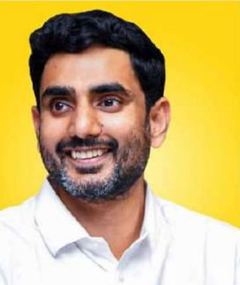
లోకేశారీగా నిర్ణయిస్తుండటంతో తాము తీవ్రంగా నష్టపోతున్నామని, కనీసం ఒక్కేసర 150000లు ఉండేలా ధరలను స్థిరం చేయాలని గోపినాథ్ కోరారు. ఈ విషయమై త్వరలో అయో కమిటీలతో మాట్లాడి సమస్య పరిష్కరిస్తామని మంత్రి లోకేష్ భరోసా ఇచ్చారు.

స్పందించి ఫిషరీస్ అధికారులను ఈ సమస్యను పరిష్కరించాలని ఆదేశించారు. దీంతో ఫిషరీస్ కమిషనర్.. సంస్థ ప్రతినిధులతో మాట్లాడి పసిఫిక్ మహాసముద్రం నుంచి తల్లి రొయ్యను తెప్పించి, స్థానికంగానే సీడ్ తయారుచేసి ఇక్కడి రైతులకు ఇచ్చేందుకు అంగీకరించారు. అంతేకాక ప్రకాశం జిల్లాలో ఇటీవల సరఫరా చేసిన సీడ్ సరిగా లేకపోవడంతో నష్టపోయామని రైతులు చెప్పినంతో మంత్రి కార్యకర్త కమిషనర్, సంబంధిత అధికారులను అక్కడకు పంపించారు. నష్టపోయిన సుమారు 300మంది రైతులకు మళ్లీ నాణ్యమైన సీడ్ సరఫరా చేసేందుకు వైస్సెల్ సంస్థ అంగీకారం తెలిపింది. కేవల మొయిల్ సమాచారంతో తమ సమస్యను పరిష్కరించిన మంత్రి లోకేష్ కు గోపినాథ్ కృత జ్ఞతలు తెలిపారు. రెండేళ్లుగా తాము ఎదుర్కొంటున్న సమస్య లోకేష్ కారవంతో పరిష్కారమైందని హర్షం వ్యక్తంచేశారు. రైతులనుంచి రొయ్యలను కొనుగోలు చేసే ఎగుమతిదారులు ధరలను