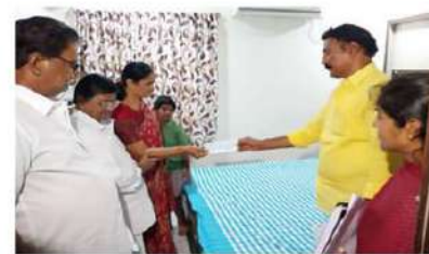
ముఖ్యమంత్రి నారా చంద్రబాబునాయుడు వరద బాధితులకు కావాల్సిన సహాయ కార్యక్రమాలను చేపడుతూ వారికి రక్షణగా నిలుస్తున్నారని, విజయవాడకు వరద కాటంగా మారితే ఇటువంటి పరిస్థితుల్లో చంద్రబాబు ముఖ్యమంత్రిగా ఉండటం ప్రజలకు వరయని ఎమ్మెల్యే గద్దె రామమోహన్ చెప్పారు.

విజయవాడ (చైతన్యరథం): ముఖ్యమంత్రి నారా చంద్రబాబునాయుడు వరద బాధితులకు కావాల్సిన సహాయ కార్యక్రమాలను చేపడుతూ వారికి రక్షణగా నిలుస్తున్నారని, విజయవాడకు వరద కాటంగా మారితే ఇటువంటి పరిస్థితుల్లో చంద్రబాబు ముఖ్యమంత్రిగా ఉండటం ప్రజలకు వరయని ఎమ్మెల్యే గద్దె రామమోహన్ చెప్పారు. తూర్పు నియోజకవర్గ పరిధిలోని 4వ డివిజన్ వెంకటేశ్వరపల్లిలో పాటు పలు ఏరియల్లో ఆపార్ట్మెంట్ సెల్లర్లలో నిల్వ ఉన్న వరద నీటిని పైర్ ఇంజనీర్ల సహాయంతో తొలగించే కార్యక్రమం శుక్రవారం ఉదయం చేపట్టారు. తూర్పు నియోజకవర్గం ఎమ్మెల్యే గద్దె రామమోహన్, పైర్ టీడీపీ మాదిరిపెట్టి ప్రకాష్ దగ్గరుండి ఈ పనులను పర్యవేక్షించారు. ఈ సందర్భంగా ఎమ్మెల్యే గద్దె రామమోహన్ మాట్లాడుతూ... ఏదైనా సమస్య వచ్చినప్పుడు ఎంత త్వరగా ఆ సమస్య నుంచి ప్రజలను బయటకు తీసుకువస్తారనేది ఆ పాలలకు సమర్థతపైనే ఆధారపడి ఉంటుందన్నారు. ముఖ్యమంత్రి నారా చంద్రబాబు నాయుడు తనకున్న సమర్థత, అనుభవంతో వరదల నుంచి బాధితులకు అన్ని రకాలుగా అందగా ఉంటూ వారి సమస్యలను తొలగిస్తున్నారన్నారు. ఇప్పుడు పైర్ ఇంజనీర్ల సహాయంతో అంటి సెల్లర్లలో ఉన్న వరద నీటిని సైతం తొలగించి వారికి తమ ప్రభుత్వం అందగా నిలుబడుతుందన్నారు. గతంలో కంటే మెరుగ్గా క్లీనింగ్ చేసి వారికి అభ్యున్నాహుని చెప్పారు. ముఖ్యమంత్రి నారా చంద్రబాబునాయుడు ఆలోచనలను అధికారులతో పంచుకుని వారిలో పనులు చేయిస్తున్నారని చెప్పారు. 200 సంవత్సరాల్లో ఎన్నడూ చూడని వరదను సైతం చంద్రబాబునాయుడు తనకున్న మేధావక్తితో ప్రజలకు ఇచ్చింది