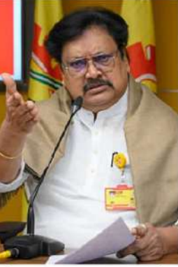
నేవించి ఉన్నారు. అరెస్టు చేసిన వారందరికీ డ్రగ్స్ టెస్టులు కూడా నిర్వహించాలని కోరారు. ఇందులో జగన్ రెడ్డి పాత్ర ఎంత? సజ్జల పాత్ర ఏమిటి? ఇంటిలిజెన్స్ పాత్ర ఏమిటి? అనేది నిగ్గు తేల్చే కుట్ర మొత్తం బయటకుతీయాలని డిమాండ్ చేశారు.

పలహారాల సజ్జలకు తెలియకుండానే టీడీపీ కేంద్ర కార్యాలయంపై దాడి జరిగిందా? అని ప్రశ్నించారు. అధికారాన్ని అడ్డం పెట్టుకుని దాడి చేయటం, కేసును సరిగ్గా విచారణ చేయకుండా పక్కన పడేశారు. 2024 ఎన్నికల్లో టీడీపీ అధికారంలోకి వచ్చాక ఆ కేసు దర్యాప్తును వేగవంతం చేసినట్లు తెలిపారు. పార్టీ కార్యాలయంపై దాడి పెద్ద కుట్ర.. పక్కా ప్రణాళిక ప్రకారమే జరిగింది.. దీని వెనుక ఉన్న అసలు సూత్రధారులను బయటకు తీయాలని డిమాండ్ చేశారు. అరెస్టు అయిన వారిని, అరెస్టు కోలోతున్న వారిని కూడా పోలీసు కస్టడీలోకి తీసుకోవాలి.. ఈ కుట్రలో అసలు సూత్రధారులు ఎవరు? దాడి చేయడం చేసిన వారు ఎవరో పోలీసులు బయటకు తీయాలని కోరారు. దాడి సమయంలో అందరి చేతుల్లో బీరు బాటిళ్లు ఉండటం అ రోజు నేను చూశాను.. మంచి వారికి ఎవరు పోయిందారు.. ఎంత తాగకపోతే వారు కేంద్ర కార్యాలయంపై ముందు ఉండగానే బాటిళ్లు విసిరికొట్టి ఉంటారు.. డ్రగ్స్ కైత