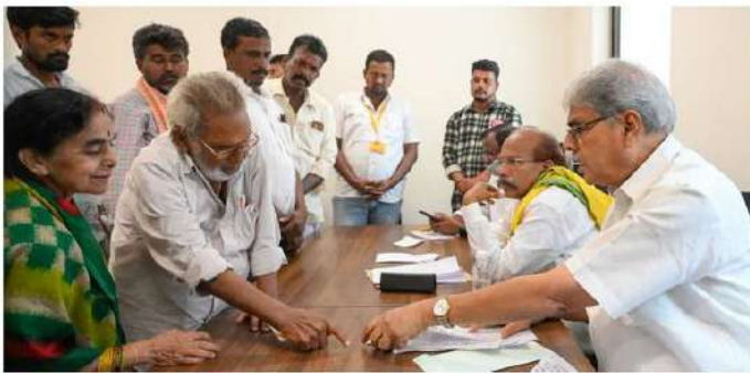
భూమి కొట్టినందుకు కుట్ర చేస్తున్నారని ఆరోపించిన టీడీపీ నేతలతో కలెక్టరును కలవరించిన బాధితురాలు.