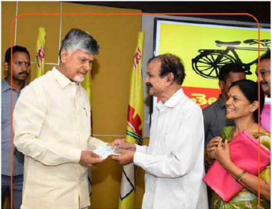
కష్టంలో ఉన్నవాళ్ల కోసం కదిలాచేస్తానంటూ గొప్పవాళ్లే. కొందరి కష్టం అందరి కష్టంగా.. దాతలంతా ముఖ్యమంత్రి సహాయ నిధికి విరాళాలివ్వడం గొప్ప అనుభూతినిస్తుంది. విరాళమిచ్చిన దాతలపేర్లు వుదాహరణ.