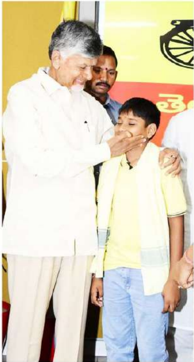
సాయం చేయడానికి వయసు కాదురా.. కావాల్సింది చూసు. బాధితులకు సాయం చేయాలన్న నీ ఆలోచన ఘేష.