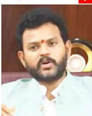
అభివృద్ధిని వివరించారు. ఓర్కాల్లో 2,621 ఎకరాల్లో పారిశ్రామిక కారిడార్లు ఏర్పాటు చేయనున్నట్లు తెలిపారు. ఇందుకోసం రూ.2,786కోట్లు వెచ్చించనున్నట్లు పేర్కొన్నారు. దీని ద్వారా దాదాపు 45వేల మందికి ఉపాధి

కొప్పర్ల... విశాఖ-చెన్నై ఇండస్ట్రియల్ కారిడార్ లో, ఓర్కాల్. హైదరాబాద్-బెంగళూరు ఇండస్ట్రియల్ కారిడార్లో భాగంగా ఏర్పాటున్నారు. ఓర్కాల్, కొప్పర్లలో మౌలిక వసతులు ఏర్పాటు చేస్తామని చెప్పారు. కొప్పర్లలో పునరభివృద్ధి కల్పి, ఇంజనీరింగ్, కెమికల్, మెటాలిక్, నాన్ మెటాలిక్, టెక్స్ టైల్స్, ఆటోమొబైల్ కంపెనీలు వస్తాయని అన్నారు. ఇక్కడ రూ.8,800 కోట్ల పెట్టుబడులు వచ్చే అవకాశముందని తెలిపారు. కొప్పర్లలో పారిశ్రామిక హాబీ కింద 2,596 ఎకరాలను అభివృద్ధి చేయనున్నట్లు వెల్లడించారు. దీని కోసం కేంద్ర ప్రభుత్వం రూ.2,137కోట్లను అప్పు చేయనుందన్నారు. ఈ హాబీలో 54,500 మందికి ఉపాధి