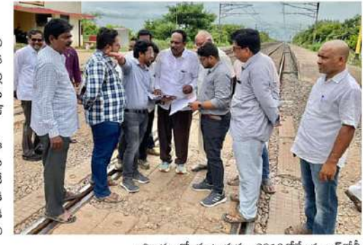
గత ప్రభుత్వంలో బ్రిడ్జి నిర్మాణం ఆగింది

అలైన్మెంట్, రంగంపురా-కొయ్యూరు రోడ్డు దగ్గర సుంచి ఎడమవైపు శాలివాహన కాంపస్ మీదుగా వీరవల్లి రెండు చెరువుల బండ్లను ఒక అలైన్మెంట్ రూపొందించటం జరిగిందని తెలిపారు. ఈ విషయాన్ని ఉన్నతాధికారుల దృష్టికి తీసుకువెళ్లి త్వరలోనే ఆర్వోబీ నిర్మాణానికి టెండర్లు పిలవటానికి చర్యలు తీసుకుంటామని తెలిపారు.