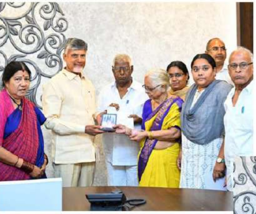
వరద బాధితుల సహాయార్థం లక్ష రూపాయల చెక్కు 16 గ్రామాల బంగారు బ్రాన్లెట్లను సీఎం సహాయ నిధికి అందిస్తోన్న జంపాల భావనారాణి, శారద