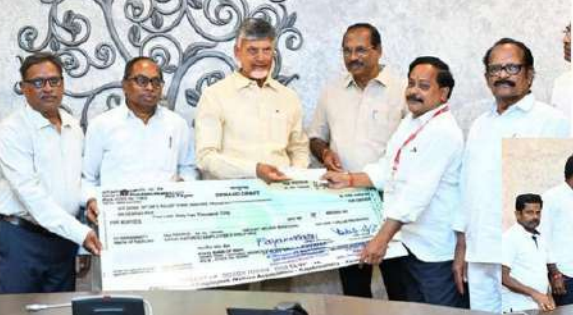
సీఎంఆర్ఎఫ్కు రూ. 4.62 లక్షల చెక్కు అందిస్తోన్న ఓఎస్ఎస్ రిటైర్ ఎంప్లాయిస్ అసోసియేషన్ ప్రతినిధులు.