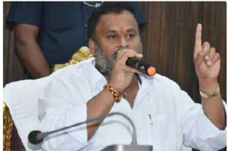
రాజకీయాలకు అతీతంగా రాయచోటి పురపాలక అభివృద్ధి పనులు చేపట్టడం జరుగుతుందని చెప్పారు. ఇందుకు పురపాలక పాలకవర్గం సహకారం ముందస్తు వ్యూహం పెట్టమని, పేదలకు ఇబ్బంది కలిగించే ప్రాజెక్టులను తప్పనిసరిగా తొలగించాలని ఆయన పేర్కొన్నారు. వెలిగింపు నీటి పథకం ద్వారా పట్టణానికి