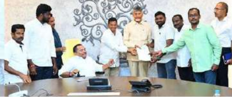
సీఎంఆర్ఎఫ్కు రూ.2.46 లక్షల చెక్కును చంద్రబాబుకు అందిస్తున్న ఆంధ్రప్రదేశ్ అసోసియేషన్ ఆఫ్ డెప్ ప్రతినిధులు.