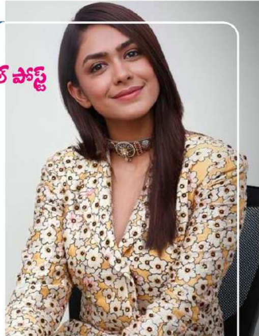
టైమ్లో తోడుగా మారిన అందమైన ముత్యాల హీరోకి దర్శనాదాయి!" అని రాసుకొచ్చింది.

"ఈ రోజు నా స్వల్ప, మేకప్ అల్టిస్ట్, నా సోలోమేట్ ఫుట్టిన రోజు. నన్ను మీరాబాయిగా, చిన్ని కృష్ణుడిగా, రాజుస్థాని ద్వాన్తర్గా ఎప్పుడూ ఎదో ఒక గెటప్తో రెడీ చేస్తూ వచ్చాను. సూపర్ 90, హామీ నాన్న చిత్రాల్లోనూ మ్యూజిక్ సృష్టించాను. నీ క్రియేటివిటీకి, ఓపికకు, ప్రేమకు కృతజ్ఞతలు తెలుపుతున్నాను. నువ్వు లేకుండా నేను ఏం చేయగలను. నా సోదరిని మాత్రమే కాదు సోలోమేట్ కూడా.. నాకు అందగా నిలబడినందుకు థాంక్యూ నిన్ను మనస్ఫూర్తిగా ప్రేమిస్తున్నాను. మేకప్ నీ సృష్టిగా ఎంచుకున్నాను. దీని ద్వారా ఎంతోమంది కళ్ళలో ఆనందాన్ని నింపుతున్నాను. ఇంతకంటే గర్వకారణం ఇవేమీకంటే. నాకు ఎప్పుడీ లే