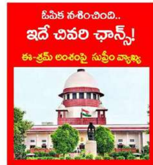
పినిక సుశీలించింది.. ఇదే చివరి ఛాన్స్!

ధిల్లీ: వలస కార్మికులకు రేషన్ కార్డుల జారీలో జాప్యం చేస్తున్న రాష్ట్రాలు, కేంద్రపాలిత ప్రాంతాలపై సుప్రీం కోర్టు తీవ్ర ఆనందం వ్యక్తం చేసింది. ఈ-క్రమ పోర్టల్లో పేషన్ కార్డుల జారీ చేయడం అలవాటుపడడంతో చెప్పాలని నిలబడింది. రేషన్ కార్డుల కోసం ఈ-క్రమ పోర్టల్లో నమోదు చేసుకున్న వలస కార్మికులకు కార్డుల జారీలో జరుగుతున్న జాప్యంపై రాష్ట్రాలు, కేంద్రపాలిత ప్రాంతాలపై సుప్రీంకోర్టు తీవ్ర ఆనందం వ్యక్తం చేయడం ఇదే మొదటిసారి కాదు. అయితే, సమస్య అలాగే ఉండడంతో... రాష్ట్రాల తీరు అందోకనకరమని, ఈ విషయంలో తమకే ఓపిక సంతోషించిన కూడా సుప్రీంకోర్టు వ్యాఖ్యానించింది. 'ఈ ఆంశంలో ఎలాంటి ఉదాసీనతకు చోటులేదని మరోసారి స్పష్టంగా చెబుతున్నాం. ఇక మాకు ఓపిక సంతోషించి, మా ఉద్దేశ్యలు