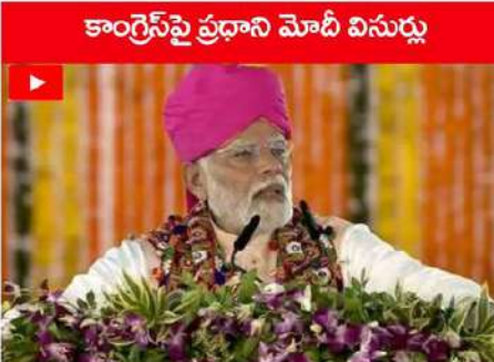
కాంగ్రెస్ పై ప్రధాని మోదీ విసుర్లు

ముంబయి: ప్రధాని నరేంద్రమోదీ కాంగ్రెస్ పార్టీపై మండిపడ్డారు. డ్రగ్స్ సామ్మతో కాంగ్రెస్ పార్టీ ఎన్నికల్లో పోటీ చేస్తోందని విమర్శించారు. ఇటీవల ఢిల్లీలో యా బేల కోర్టు విలువైన డ్రగ్స్ పట్టణే తేమలో కాంగ్రెస్ నేత ప్రమోదయం ఉన్నట్లు ఆరోపణలు చేశారు. విషయం తెలిసినదే ఈ క్రమంలో శనివారం మహారాష్ట్రలోని వాసంట్ నిర్వహించిన సభలో పాల్గొన్న ప్రధాని డ్రగ్స్ కేసును ప్రస్తావించారు. యువతను కాంగ్రెస్ ముఠాకేంద్రంగా బ్రెయిన్ వేస్తోంది. గెలవాలని భావిస్తోంది ఆరోపించారు. కాంగ్రెస్ ను అప్పుడే నక్కల్లో మూత పాటిస్తోంది, ఆ పార్టీ