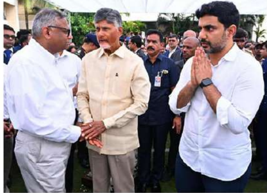
ముంబయిలో రతన్ టాటా పార్శ్వ దేవాలయానికి నివాళులర్పించిన సీఎం చంద్రబాబు, ఐటీ మంత్రి నారా లోకేశ్