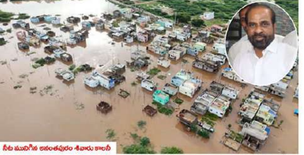
నీటమునిగిన అనంతపురం-శివారు కాలనీ