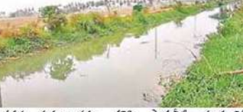
నియోజకవర్గ సభ్యులందరూ కలిసి సాగునీటి సంఘానికి అధ్యక్షుడు మరియు ఉపాధ్యక్షులను ఎన్నుకుంటారు.

అమరావతి (వైతన్యరథం): రాష్ట్రంలో సాగునీటి వినియోగదారుల సంఘాలకు మంగళవారం నుంచి ఎన్నికలు ప్రారంభమైతాయి. గత ఐదేళ్ల వైసీపీ పాలనలో సాగునీటి సంఘాలకు ఎన్నికలు జరపాలన్న ఆలోచన రాలేదు. నిధులూ ఇవ్వలేదు. రాష్ట్రంలో 21,060 మేజర్, 3192 మీడియం, 24,768 మైనర్ మొత్తంగా 49,020 ప్రాథమిక సంఘాలు, 6,149 సాగునీటి వినియోగదారుల సంఘాలు ఉన్నాయి. వీటికి ఎన్నికలు నిర్వహించడం ద్వారా సాగునీటి వనరులను పరిరక్షించుకునే విధానం ఉమ్మడి ఏటలో డి.డి.పీ ప్రభుత్వం హయాంలో అమలులోకి వచ్చింది. దీనిని 2019 డాకా కొనసాగించారు. ఆయత, 2019-24 మధ్య ప్రాజెక్టుల యూజుమాన్స్ నిర్వహణ తరహాలోనే సాగునీటి సంఘాలనూ నాడి సీఎం జగన్ నిర్వహించే చేశారు. 2024 సార్వత్రిక ఎన్నికల్లో కూటమి ప్రభుత్వం అధికారంలోకి వచ్చాక ఘడ్డీ సాగునీటి సంఘాలకు ఎన్నికలు నిర్వహించాలని నిర్ణయించారు.