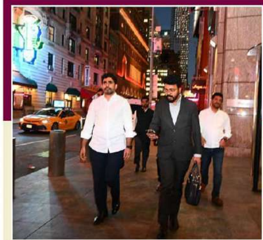
న్యూయార్క్ మహానగరంలో ట్రాఫిక్ రద్దీ దృష్ట్యా తాను బస్ చేసిన హెటర్ల సమీపంలో ఒక పారిశ్రామిక వేత్తను కలవడానికి వాహనం వదిలేసి కాబినడకన వెళ్ళిన మంత్రి నారా లోకేష్.