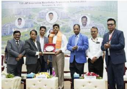
నిర్వహించిన వికాస్ - 2024 కార్యక్రమాలకు ముఖ్య అతిథిగా పెమ్మసాని పాల్గొని మాట్లాడారు. 2024 ముందు భారత దేశంలో కేవలం ఇతి తక్కువ సంఖ్యలో స్టార్టప్ లు ఉండేవని, ప్రస్తుతం 1.12 లక్షల స్టార్టప్ కంపెనీలు ఉన్నాయని, యూనికాస్ట్ నాలుగు మాత్రమే ఉండేవని, ప్రస్తుతం 1100 ఉన్నాయని చెప్పడానికి గర్వంగా ఉందన్నారు. భారతదేశం జనాభా,

గుంటూరు (చైతన్యరథం): 'సమాజానికి దోహదపడే నూతన ఆవిష్కరణలతో జిల్లాపాత పాఠశాలకువేళ్లలు ముందుకు రావాలి. ప్రధాన మంత్రి నరేంద్ర మోడీ, ముఖ్యమంత్రి నారా చంద్రబాబునాయుడు వంటి లీడర్ల విజనరీతో భారతదేశంలో స్టార్టప్లకు గొప్ప అవకాశాలు ఉన్నాయి. వికసిత భారత్ కార్యక్రమం ద్వారా మారుమూల ప్రాంతాల్లోనూ దాగి ఉన్న ప్రతిభావంతులను వెలికితీసి, పరిశ్రమల స్థాపనకు ప్రోత్సాహం అందిస్తున్నాం.' అని గ్రామీణ అభివృద్ధి, కమ్యూనికేషన్స్ శాఖ కేంద్ర సహాయ మంత్రి పెమ్మసాని చంద్రకేఠర్ అన్నారు. అమరావతిలోని విడిగ్(వేలూరు అన్నిటూర్ అఫ్ టెక్నాలజీ) యూనివర్సిటీలో శుక్రవారం