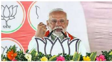
మహాబలం. ఇది అందరినీ ఏకతాటిపై ఉంచుతుంది" అని మోదీ పిలుపునిచ్చారు.