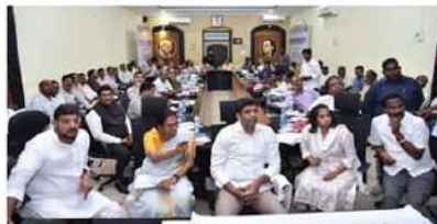
గుంటూరు (చైతన్యరథం): 'నగరంలో జరుగుతున్న అభివృద్ధి కార్యక్రమాలపై ప్రతివెల ఒక రిఫ్లెక్షన్ సమావేశం ఏర్పాటు చేసుకుంటున్నాం. అందులో భాగంగా శంకర్ విలాస్ ఆరీఓబి అభివృద్ధి దీక్షిష్ట, శ్యామల నగర్ వంచెన విస్తరణ, మంగళగిరిలో నిన్నటి మరులు ఎల్వి - 14 వంచెనతో పాటు

నగరంలో చేపడుతున్న చెత్త సేకరణ తదితరాలపై సంబంధిత అధికారులతో చర్చించాం.' అని పెమ్మసాని చెప్పారు. స్థానిక కలెక్టరేట్‌లోని వీడియో కాన్ఫరెన్స్ హాల్లో జిఎంపీ, రైల్వే ఆర్ 7/ఎడ/ఓ బి, ఎస్ హెచ్ ఏ బి(జాతీయ రహదారుల) శాఖ అధికారులతో గుంటూరు నగర అభివృద్ధి అంశాలపై గ్రామీణ అభివృద్ధి, కమ్యూనికేషన్స్ శాఖ కేంద్ర సహాయ మంత్రి డాక్టర్ పెమ్మసాని చంద్రశేఖర్ సమీక్ష సమావేశాన్ని కుక్కువారం నిర్వహించారు. కార్యక్రమం అనంతరం విలేజ్ కర్రులతో ఆయన మాట్లాడుతూ... 'శంకర్ విలాస్ ఆర్.ఓ.బి వంచెన నిర్మాణానికి సంబంధించి నిర్మాణాల దీక్షిష్ట పరిశీలనలపై చేశాం. జూలై 2026 కల్లా నిర్మాణం పూర్తి చేసే విధంగా అధికారులకు తెలియజేశాం. 25 అడుగుల ఎత్తున వంచెన నిర్మాణాన్ని 55 అడుగుల ఎత్తుకు చేపట్టేలా సూచనలు ఇచ్చాం. 900 అడుగుల వెడల్పు తో నిర్మాణం చేయించేయాలని ప్రయత్నిస్తున్నాం. రైల్వే అధికారులతో మాట్లాడి భూ సేకరణ కార్యక్రమాలను కూడా చేపడుతున్నాం. జిఎంపీ వరధిలో పాంశుద్ధ్య నిర్వహణ లో భాగంగా ఎన్ని పుష్ కాట్లు, ఎన్ని డ్రాక్షిఫ్ట్ ఇరుగుతుంది అనే అంశంపై చర్చించాం. ఈ - ఆలోచన అందుబాటులోకి తీసుకొచ్చే విధాన్ని కేసుగా మున్సిపల్ కార్పొరేషన్లకు సంబంధించిన పిఎస్(ప్రా-విడెంట్ ఫండ్) ఈ.ఎస్.బి సంబంధిత సమస్యలపై సంబంధిత శాఖ అధికారులతో చర్చించాం. అందుచేత ఒక చోటికి తీసుకువచ్చి ఏవైతే సమస్యలు ఉన్నాయో వాటిపై సుదీర్ఘమైనట్లు వచి చర్చలు జరిపి సమస్యలు తీర్చి విధిగా నిర్ణయాలు తీసుకున్నాం.' అని చెప్పారు. ఈ కార్యక్రమంలో ఎమ్మెల్యేలు జూబ్లీ రౌండు/జనయలు, గల్లా మాధవి, మొహమ్మద్ సనీర్ అహ్మద్, ఎమ్మెల్యే లక్ష్మణరావు, కలెక్టర్ నాగలక్ష్మి, జిఎంపీ కమిషనర్ పులి శ్రీనివాసులతో పాటు సంబంధిత శాఖ అధికారులు పాల్గొన్నారు.