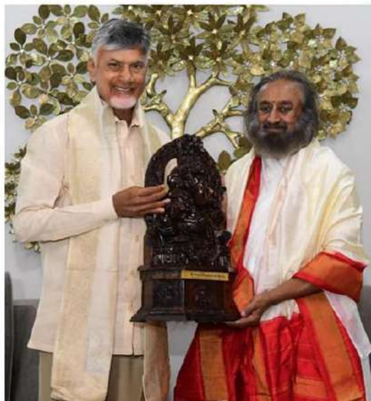
ఆర్ట్ ఆఫ్ లివింగ్ వ్యవస్థాపకులు రవిశంకర్ బుధవారం ఉండవల్లిలోని ముఖ్యమంత్రి నివాసంలో సీఎం చంద్రబాబు నాయుడిని మర్యాదపూర్వకంగా కలిశారు. రవిశంకర్ను సాదరంగా స్వాగతించిన ముఖ్యమంత్రి చంద్రబాబు.. ఆయనతో కొద్దిసేపు ముచ్చటించిన అనంతరం గౌరవ సత్కారం అందించారు.