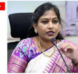
అయినా, వారిని వదిలిపెట్టే ప్రసక్తి లేదని స్పష్టం చేశారు. కేసులు నమోదు చేస్తామన్నారు. మహిళలను ఏదైనా అందే రాయలసీమ వాసులు ఊరకొరం, కానీ

సొంత కట్టిన, చెల్లిన తిట్టినవారిని జగన్ వింటయితకయాదని ఏదైనా చేశారు. మీ తల్లిని, చెల్లిన తిట్టిన ఉన్నాయను మేం అరెస్టులు చేస్తున్నాం" అని హెంకం మంత్రి అనితకు ఉద్దేశించి మంత్రి పేర్కొన్నారు. ఎలాంటి వారికి మీరు మద్దతిస్తున్నారో ఆలోచించుకోవాలన్నారు. కొందరు పోస్టులు చూస్తే దారుణంగా ఉన్నాయని, వాళ్లు పెట్టిన పోస్టులపై కోర్టు కూడా మొట్టికాయలు వేసేదని గుర్తు చేశారు. ఇలాంటి పోస్టులు పెట్టినవారిని ఏం చేయాలో ప్రజలే చెప్పాలన్నారు. గతంలో ప్రభుత్వాన్ని ప్రశ్నించిన అనేకమంది డిలీట్ నేతలపై పోస్టులపై కోర్టు కూడా మొట్టికాయలు వేసేదని గుర్తు చేశారు. ఇలాంటి పోస్టులు పెట్టినవారిని ఏం చేయాలో ప్రజలే చెప్పాలన్నారు. గతంలో ప్రభుత్వాన్ని ప్రశ్నించిన అనేకమంది డిలీట్ నేతలపై పోస్టులపై కోర్టు కూడా మొట్టికాయలు వేసేదని గుర్తు చేశారు. ఇలాంటి పోస్టులు పెట్టినవారిని ఏం చేయాలో ప్రజలే చెప్పాలన్నారు. గతంలో ప్రభుత్వాన్ని ప్రశ్నించిన అనేకమంది డిలీట్ నేతలపై పోస్టులపై కోర్టు కూడా మొట్టికాయలు వేసేదని గుర్తు చేశారు. ఇలాంటి పోస్టులు పెట్టినవారిని ఏం చేయాలో ప్రజలే చెప్పాలన్నారు.