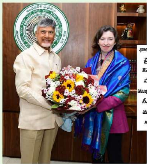
భారతదేశంలోని బ్రిటిష్ హైకమిషనర్ లిండే కెమెరాన్ బుధవారం సచివాలయంలోని ముఖ్యమంత్రి ఛాంబర్లో సీఎం చంద్రబాబును మర్యాదపూర్వకంగా కలిసినప్పటి చిత్రం