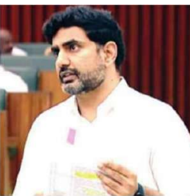
హయాంలోనే నిర్వహించారన్నారు. రాష్ట్రంలో కూటమి ప్రభుత్వం అధికారంలోకి వచ్చాక ముఖ్యమంత్రి తొలి సంతకం మోగి డిఎస్సీ పైలుపైనే