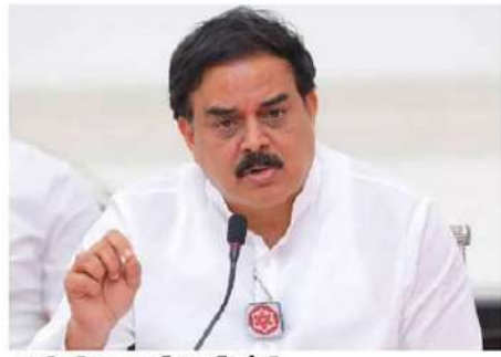
ఈజ్ ఆఫ్ డూయింగ్ ఫార్వర్డ్ సర్వీస్

నెల్లూరు (చైతన్యరథం): టీడీపీ సభ్యత్వ నమోదు ప్రక్రియను వేగవంతం చేయాలని పార్టీ నేతలకు రాష్ట్ర మంత్రి పొంగూరు నారాయణ ఆదేశించారు. నెల్లూరులోని గోపతి నగర్లోని మంత్రి క్యాంపు కార్యాలయంలో పార్టీ కార్యకర్తలు, నాయకులతో ఆదివారం సమీక్ష నిర్వహించారు. ఈ సందర్భంగా మంత్రి నారాయణ మాట్లాడుతూ గత అవేక్ష పాలన ప్రభావ వృతి రేరంగా సాగిందన్నారు. అందువల్లనే ప్రజలు ఆ ప్రభుత్వానికి వ్యతిరేకంగా ఓటి, కూటమి ప్రభుత్వాన్ని అధికారంలోకి తీసుకువచ్చారన్నారు. ఈ