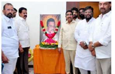
ఆత్మకు శాంతి వేకూర్చాలని